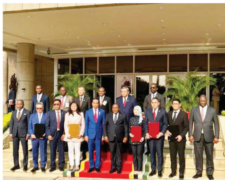
国油代表跟随佐科威总统出访非洲4国。