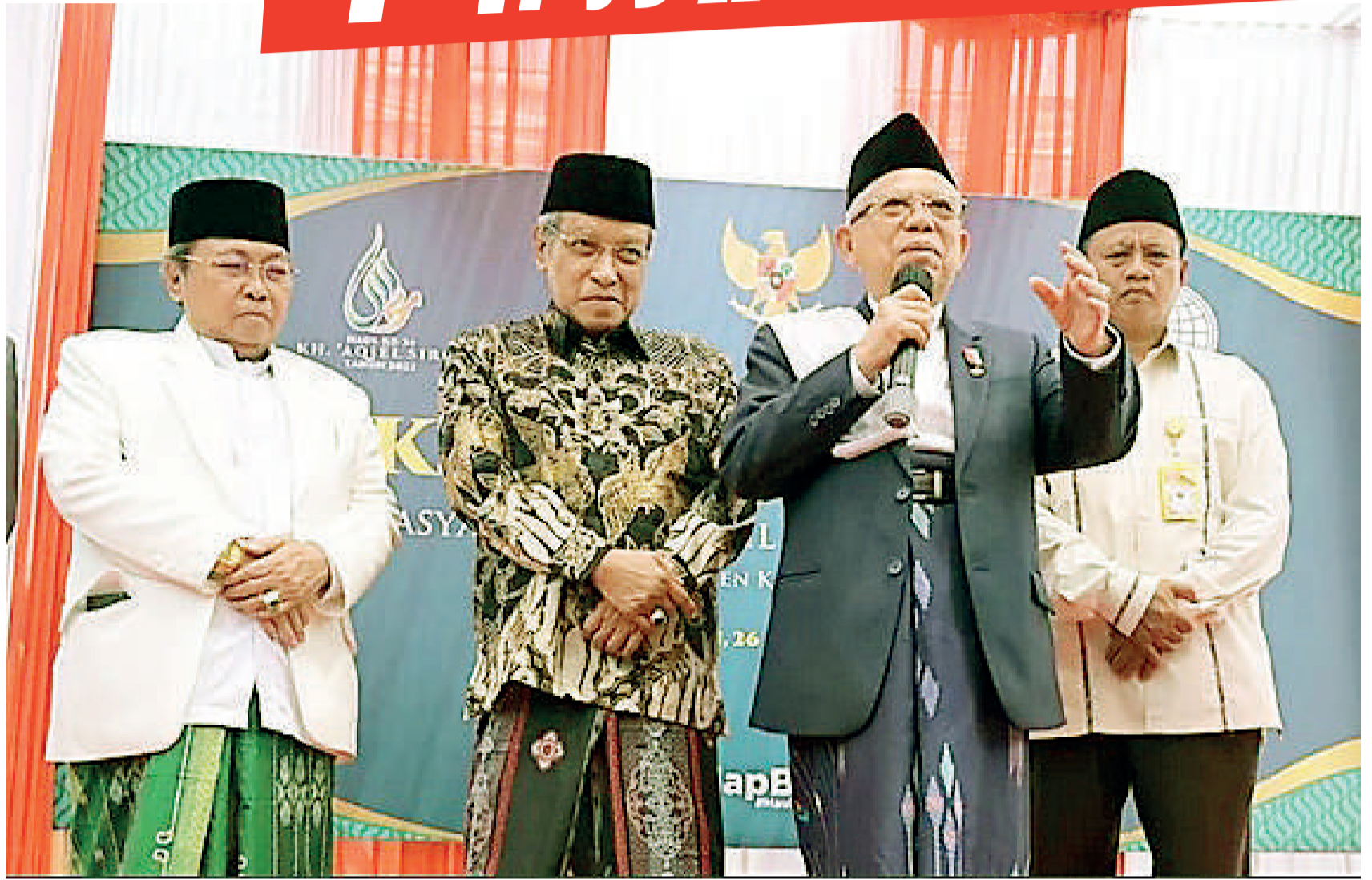
马鲁夫鼓励各方继续展开排放测试。