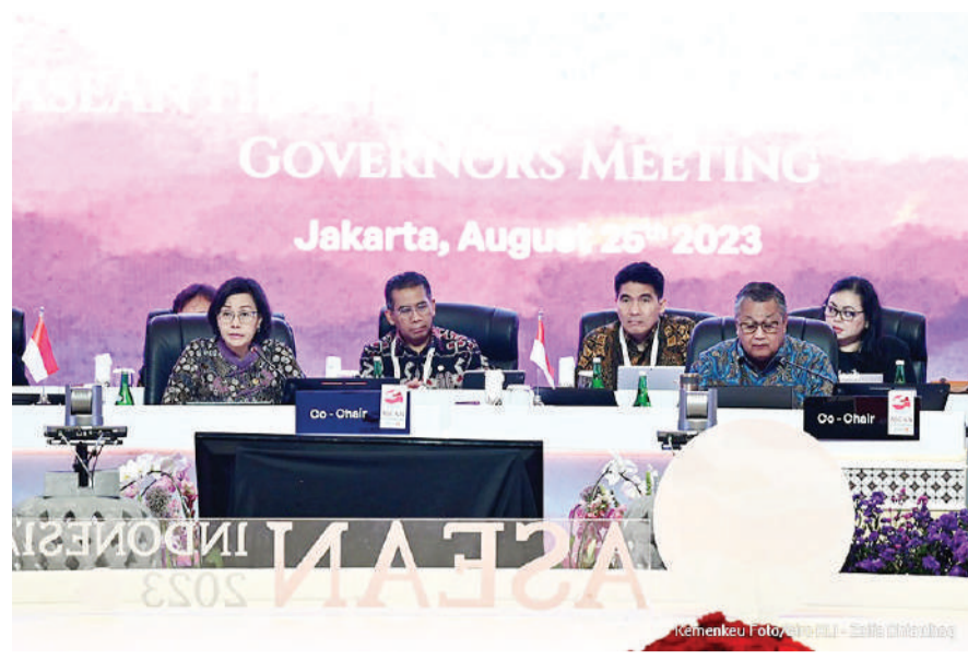
帕利(前排右起)与财政部长丝丽,出席2023年东盟财长和央行总裁会议。

拉菲指出,印尼现在不仅有代表性的足球场,还有篮球场。拉菲说:“感谢政府、佐科威先生和雅立多斯先生为这一切的实现做出了贡献。”(KP)