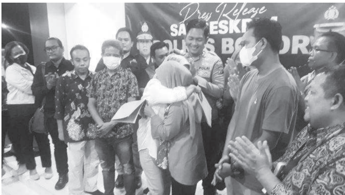
两名孩子遭互相被调换的妇女, 在新闻发布会上相拥, 并接受DNA检测结果。