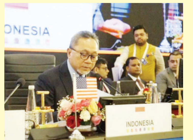
楚尔基弗里表示,科技进步提升了对效率的要求。

G20在支持数码转型中的设法形成了更大议题的一部份,包括经济、社会与环境方面在内。(MIM)