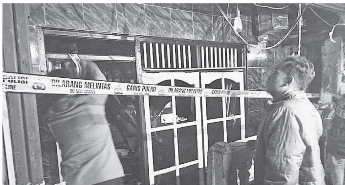
警方在火灾现场被系上警戒线展开调查。

玛德布迪称, 据目击者称, 屋内住有13人, 在该火灾13人中11人幸免 (LDS)