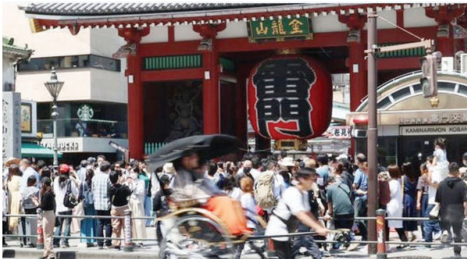
日本启动核废水排海后，中国游客纷纷取消原定在“十一长假”的赴日旅游计划。

中国北京本月10日开放旅行团赴日后，日本跃为中国“十一长假”最热门的出境旅游地。