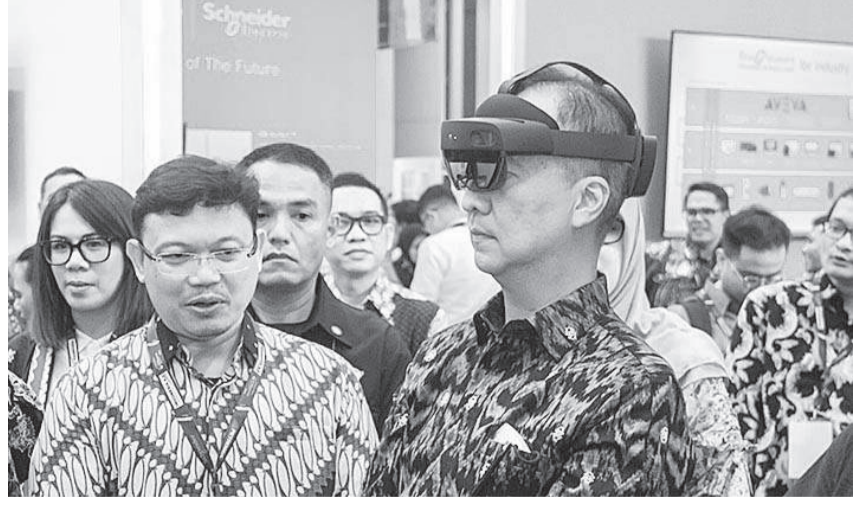
阿古斯参观参展单位时, 试戴人工智能产品。

资源的枢纽或联络人的作用, 例如获得大规模生产制造的机会、获得融资的机会、工业问题数据库的机会、参与技术实施竞争的机会、进入更广阔的市场机会、走向全球。