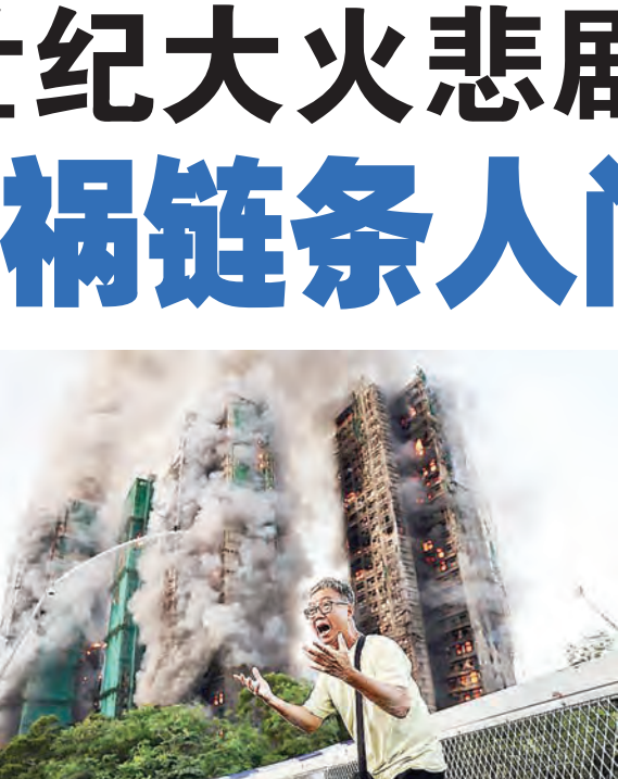
香港市民亲历家园被焚毁。