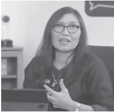
洛斯玛乌利表示，正式指定五家公司为PMSE数码税代收机构。

其他数码经济企业的税收收入来自税务投诉信息系统(SIPP)税收，截至2025年10月，该项税收收入已达3兆9200亿盾。其中，2022年收入为4023亿8000万盾，2023年收入为1兆