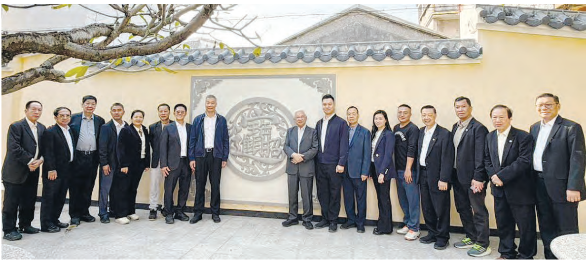
代表团在罗坑镇桂林村留影。