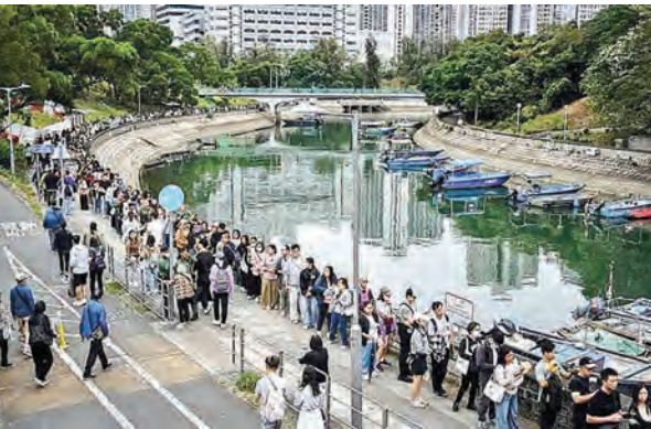
民衆在大埔排队两公里献花悼念逝者。

别人士有罪。 然而，单是这种强烈的不信任本身，已反映出宏福苑业主与法团之间关系的长期撕裂，也揭开了香港楼宇维修工程中一种黑暗的可能性：当法团与顾问、承建商构成利益共同体时，居民的安全可以弃之不顾。