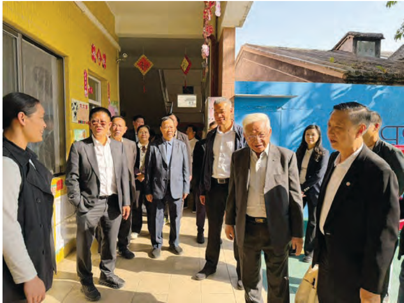
和上凌幼儿园老师们交流互动。