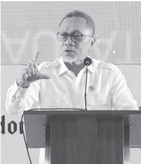
祖尔基菲里认为，印尼需要采取非常规措施。

印尼生产1公斤糖的成本却高达13000至15000盾。如此巨大的成本差异使印尼国内食品处于竞争劣势。