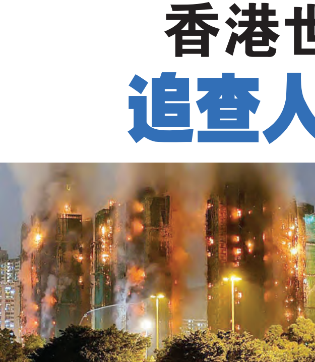
香港大埔宏福苑七栋楼宇烧成火柱，惨不忍睹。

事发当晚网上传出深圳消防正赶来驰援，后来港府澄清，香港并没有要求深圳支援。但深圳消防车辆已经在莲塘口岸集结待命，可以随时出发。由于灾场已经有二百多辆香港的消防车在现场，有人担心若深圳消防车跨境支援，可能造成现场车辆拥挤、进出困难，甚至出现指挥协调上的混乱。尽管深圳消防大规模集结待命，但港府最后没有启动《粤港澳大湾区应急管理合作暨大湾区应急救援行动合作框架协议》的机制要求请援。网上很多关于深圳无人机救火等讨论，也刺激了香港讨论是否有需要升级消防设备，包括中国大陆开发的无人机和高空炮弹式灭火器。