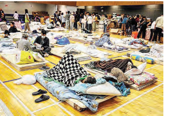
宏福苑灾民被安置在临时庇护中心。

是高层住宅中最便宜、也是最关键的保命工具，但香港消防处日前确认，八座大厦的警钟在关键时刻同时失灵，在启动时未能发出声响，令居民错过最宝贵的逃生起步时间。香港有线新闻报道，前保安主管称今年五月已发现消防警钟系统怀疑被人关闭，为了方便工人走火梯离开大厦。也有居民说，此前因工人吸烟，有向承建商反映，承建商也炒了一些人，但由于缺乏工头的监督，余下的工人屡屡再犯。