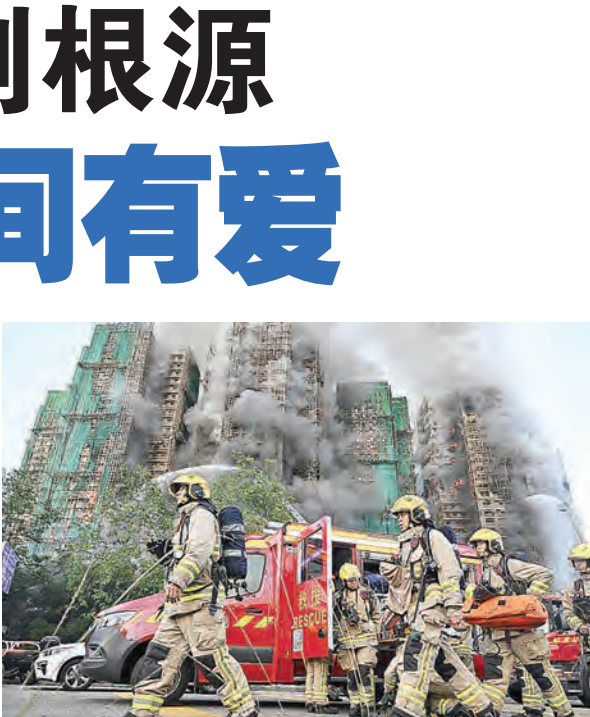
香港消防员紧急赶往宏福苑：刻不容缓。

聘请该装修公司的宏福苑业主立案法团无可避免地被推到风口浪尖，不少居民在社交平台点名曾担任法团顾问的政界人士，质疑他们在推动大维修工程、选择承建商和处理业主反对声音时扮演了不光彩的角色。但这些贴文目前仅是居民指控和舆论质疑，真伪有待执法机关厘清；评论时不宜预设个