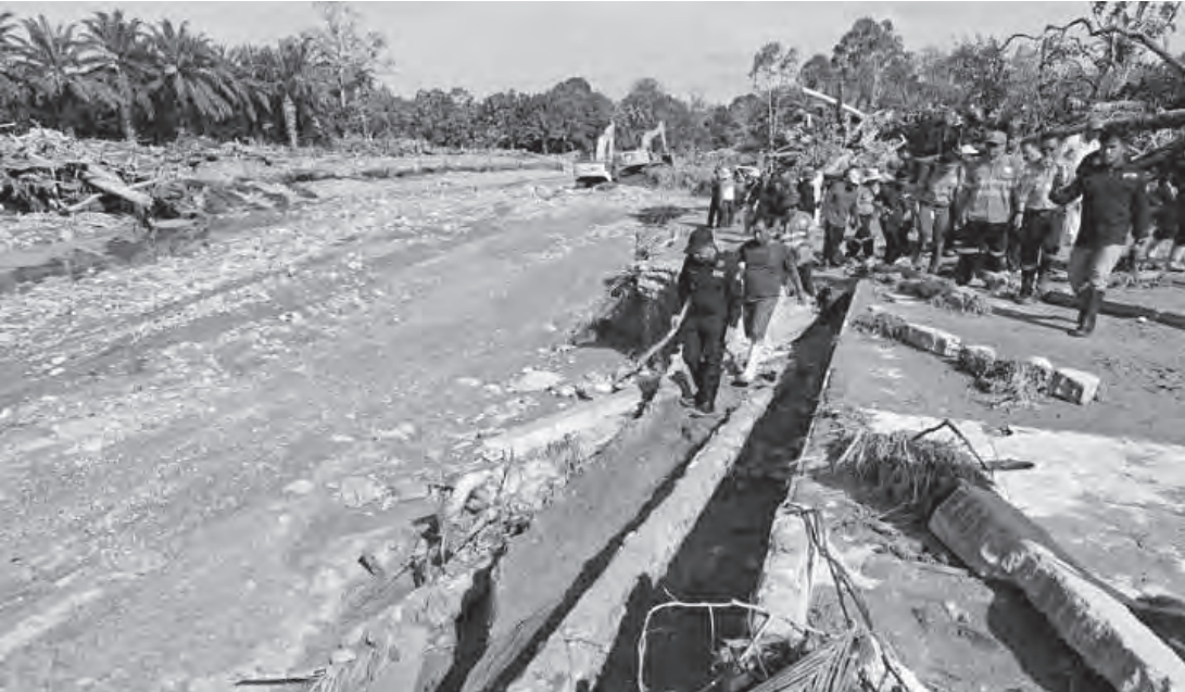
环境部已确认，洪灾冲走的大量木材，是人为伐木所致。

责任人。此外，四家大型企业——马塔贝金矿（Agincourt Resources）、巴塘托鲁水电站、Toba Pulp Lestari 和PTPN III——已被查封，所有经营活动暂停，直至环境审计完成。 “我们将继续展开调查。接下来我们可能会飞到上游去确认上游地区发生了什么情况。因为这些木材不可能自然地流到这里，可能存在需要追责的活动。”他说。