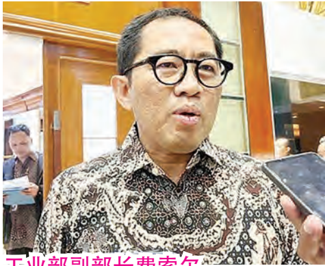
工业部副部长费索尔。