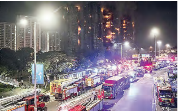
全港共调派二百多辆消防车及约百辆救护车至大埔：义不容辞。

当天夜幕未降时，已有市民自发组织捐赠和支援行动，在临时庇护中心送上物资，形成感人的“人链”。一位大叔在地铁站附近的便利店，一口气买下二十多瓶茶饮，店员一知用途，主动找纸箱帮忙打包。除人手搬运，香港人的组织力同样惊人，很快便有印着不同公司标志的货车自发协助运送物资，在几近塞死的道路上来回穿梭。