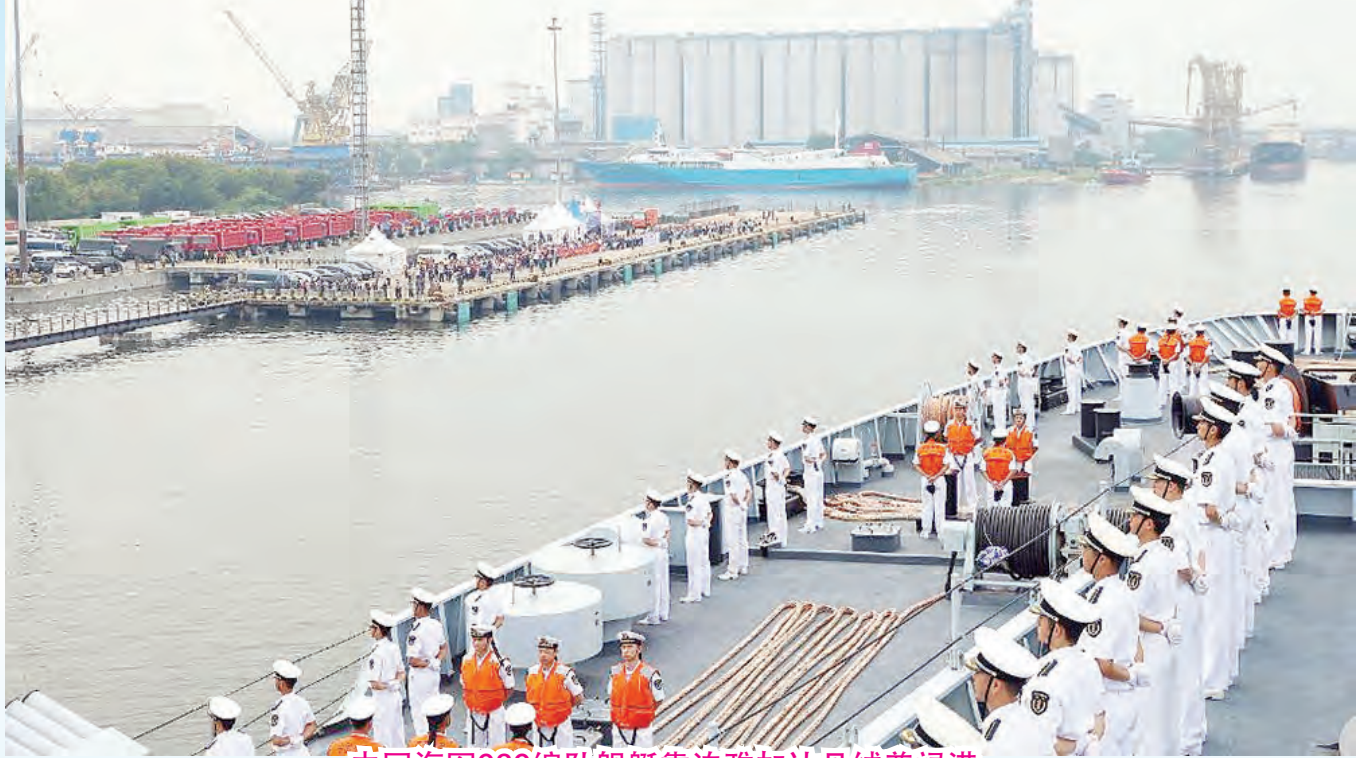
中国海军989编队舰艇靠泊雅加达丹绒普禄港。

（雅加达讯）正在执行远海综合实习任务的中国海军989编队7日抵达印度尼西亚雅加达丹绒普禄港，开始对印度尼西亚进行为期4天的友好访问。