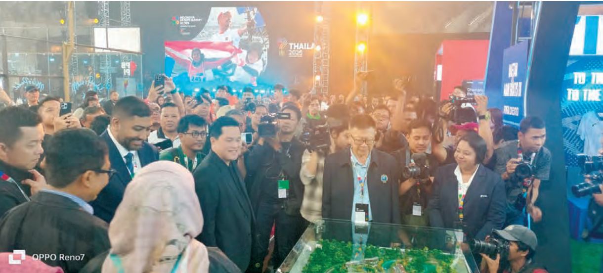
青年与体育部长雅立多斯和吴能彬博士等参观体育产业展览展位。