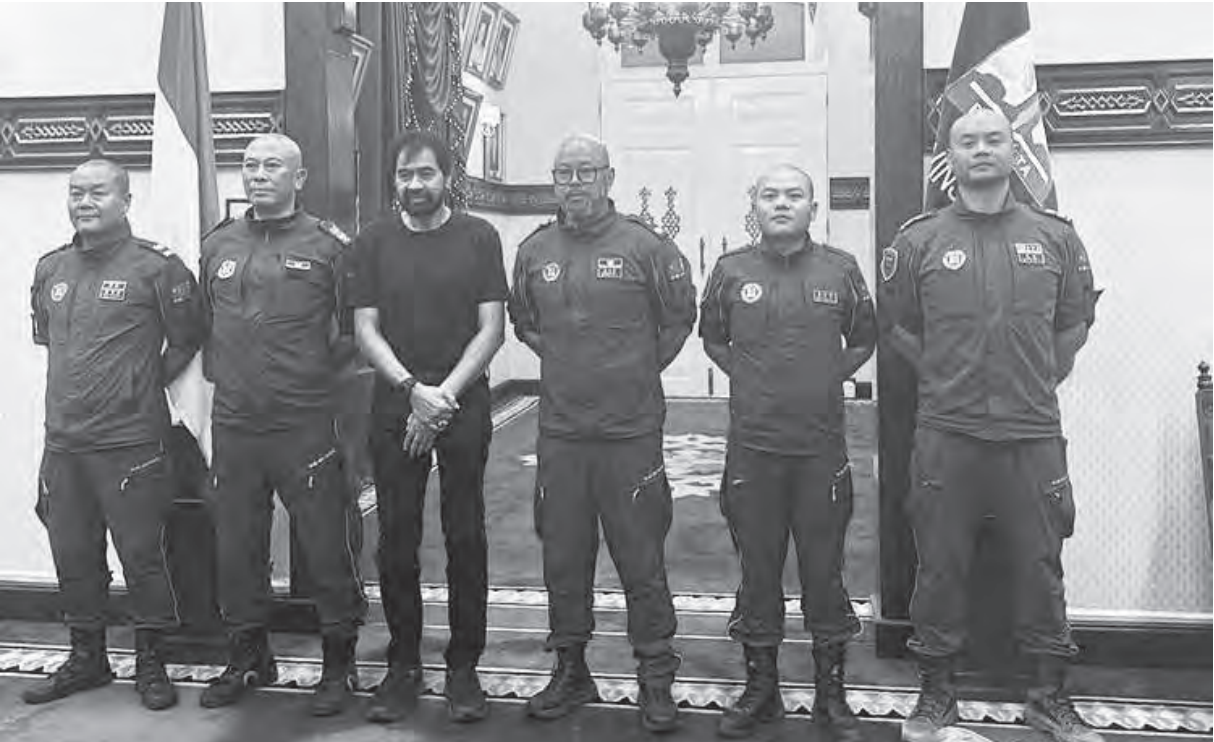
亚齐省长穆阿莱姆（左三）与中国泥浆探测队5名志愿者合影。

（班达亚齐讯）亚齐省省长穆扎基尔·马纳夫（又名穆阿莱姆）邀请来自的中国泥浆探测队，协助搜寻亚齐洪灾和山体滑坡的遇难者。据推测，仍有许多罹难者被埋在泥浆下。 据悉，这些志愿者配备了最先进的设备