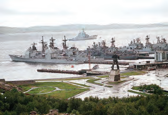
俄罗斯北莫尔斯克：北方舰队总司令部。