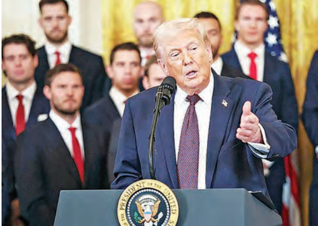
特朗普在白宫，传言支付每位格陵兰人一百万美元，但官方未证实。