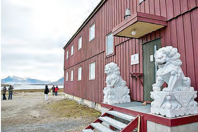
中国黄河站极地研究所一九八九年成立，专事科研。