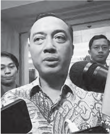
普拉斯蒂约否认出席者是反对派人士。