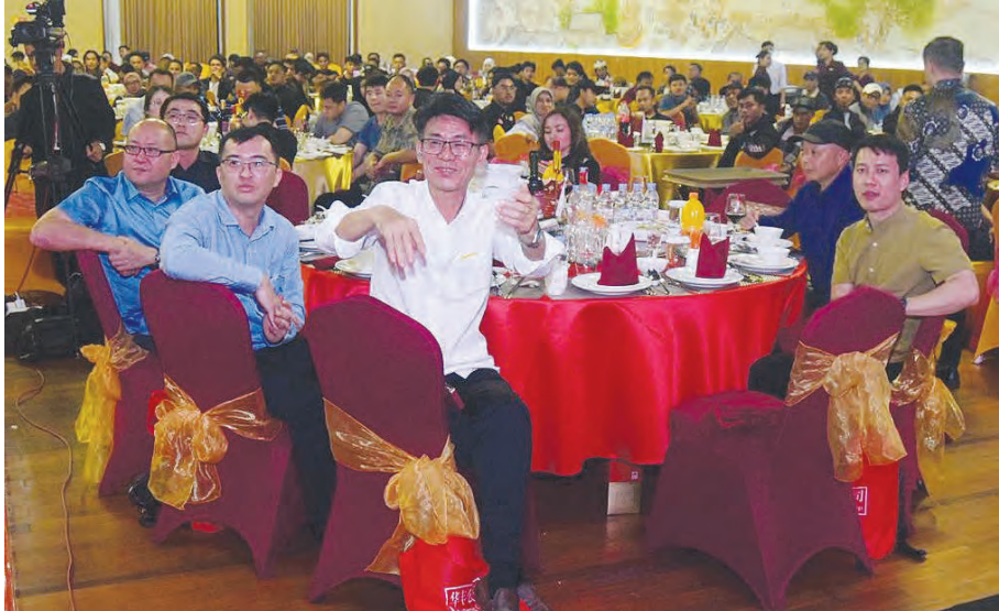
华丰公司2025年会盛典场面。