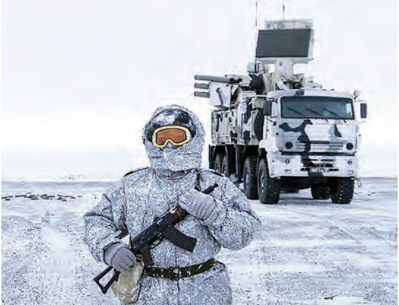
俄军北极部队：俄罗斯控制着约百分之五十的北极陆地。