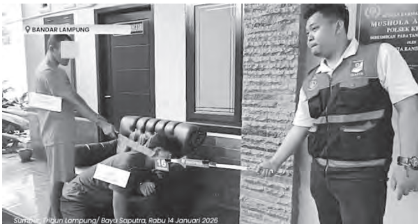
少年嫌犯被警方带返案发现场，进行案情重组。