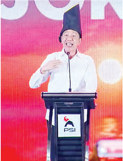
佐科威表示，将为印尼团结党全力以赴。

所有监管职能、交易活动和监督职责都将得到保障，确保其按照良好公司治理原则和国际最佳实践顺利开展。（ALW）