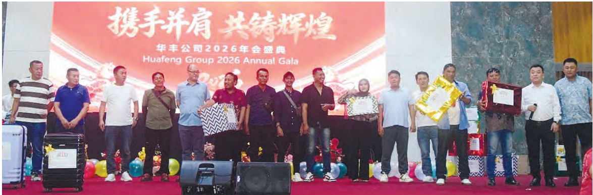
华丰团队携手并肩共铸辉煌。