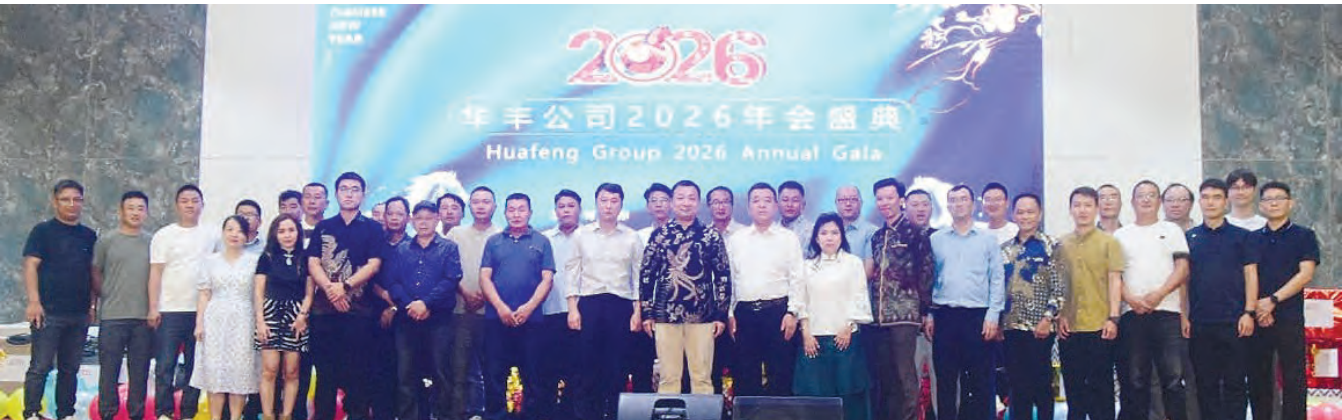
华丰公司前锋大团队合影。