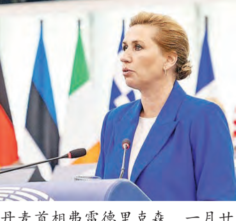
丹麦首相弗雷德里克森，一月廿三日访格陵兰，强化外交与北约军演应对美国。