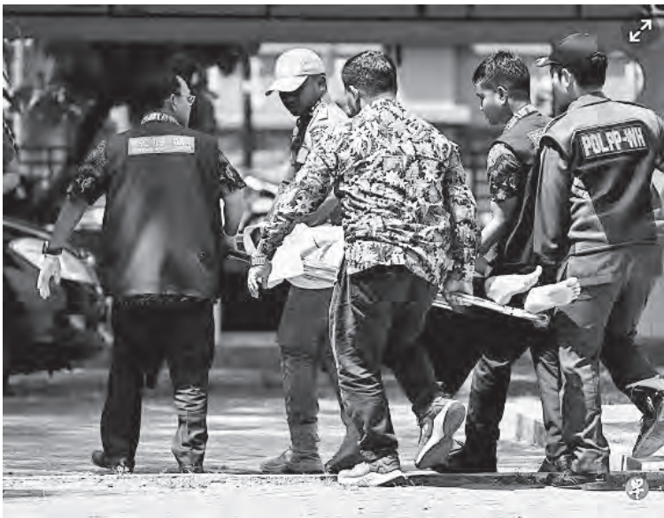
女子受刑后昏厥，被送上救护车。

还有另外四人因违反回教教规而遭鞭刑。其中一人是回教法警察，他和他的女性伴侣因在私密场所亲密接触被当场抓获，各受23鞭。