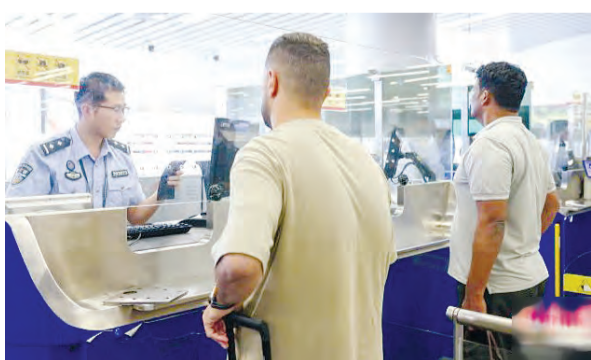
白云机场口岸,移民管理警察为外籍客商高效办理入境边检手续。

本次活动将持续至4月12日。在渝期间,代表团还将参访赛力斯汽车智慧工厂、重庆中国三峡博物馆、重庆史迪威博物馆等地。(中新网)