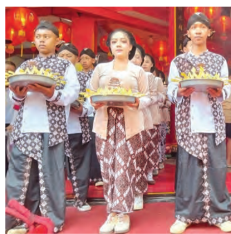
爪哇传统文化与灵福庙的祈祷仪式融合在一起，拉开了灵福庙160周年文化游行的序幕。

(三宝壟讯) 爪哇和中国文化融合的悠久历史再次在三宝壟的心脏地带熠熠生辉。为纪念灵福庙成立160周年暨福德正神诞辰，2026年4月11日至12日，成千上万的信徒和民众涌入Gang Pinggir的唐人街地区。