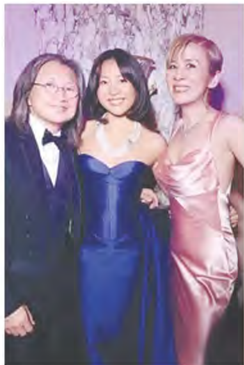
此结识了其他获邀出席舞会的女孩们。

在视频中, 陈是知用英文进行了自我介绍, 说当天身处巴黎, 正准备出席巴黎名媛舞会。她指出, 这次经历是自己“踏入社交界”的重要时刻, 并透露在正式亮相前, 她先后接受了美容护理、试穿华服、试戴珠宝并进行了拍摄, 也因