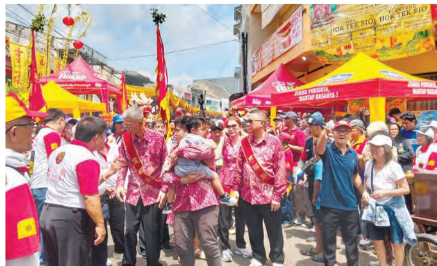
三宝壟灵福庙工作人员以及爪哇和峇厘岛的56座寺庙代表参加了此次嘉年华。

灵福庙160周年庆典圆满落幕，向印尼人民传递了一个强有力的信息：差异并非障碍，而是丰富民族认同的绚丽马赛克。如同袅袅升起的香烟，三宝壟多元的文化已融为一体，和谐共生。