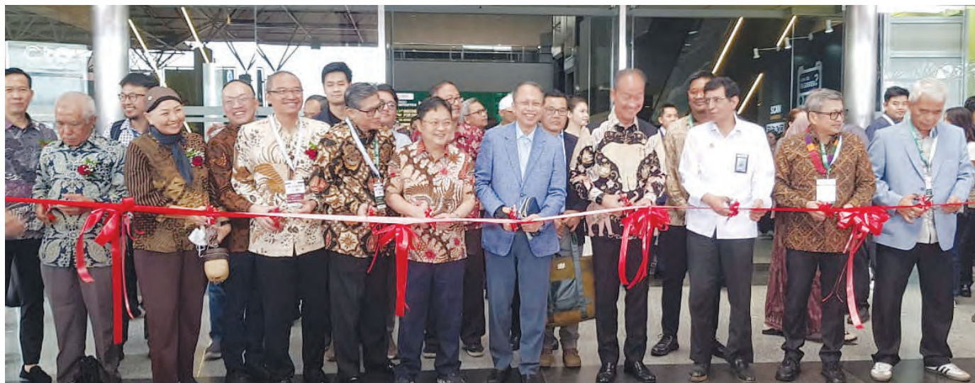
嘉宾们为2026年印尼国际纺织及纺织品展览会开幕剪彩。