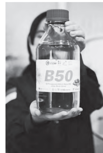
印尼推行50%生物柴油,预计每年可节省数十兆盾的补贴支出。