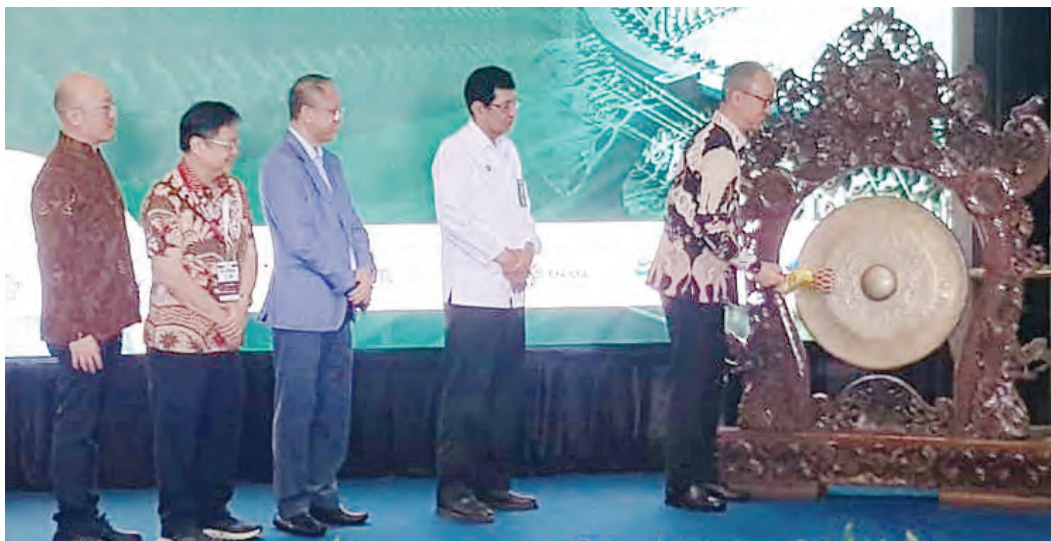
工业部长阿古斯(右)为印尼国际纺织及纺织品展览会开幕鸣锣。