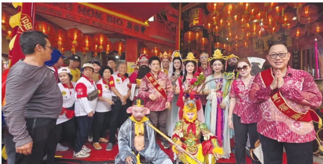
三宝壟灵福庙工作人员在开始环绕三宝壟唐人街的游行之前与郑和木偶合影。