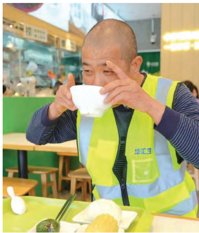
环卫工人享用爱心早餐。