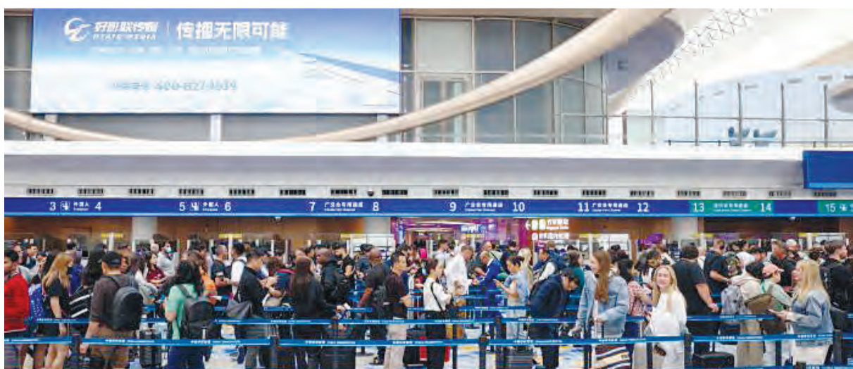
广交会开幕当天,白云机场口岸迎来入境客流高峰。

200万人次,同比增长超35%。便捷的通关服务与温馨的国门体验,正成为海外客商观察中国高水平对外开放的窗口。(中新网)