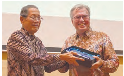
林金将辅导委员(左)赠送礼品给历史学家Didi Kwartanada(右)。