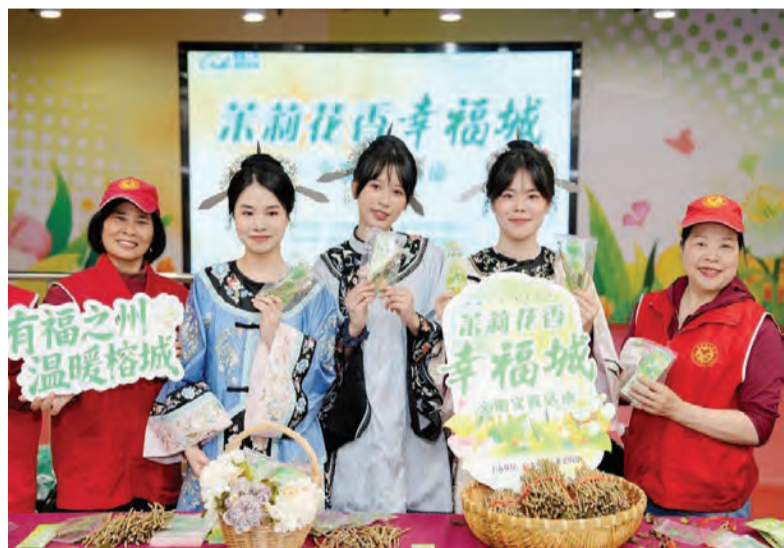
“茉莉花香幸福城”文明实践活动派送30万株茉莉花苗。