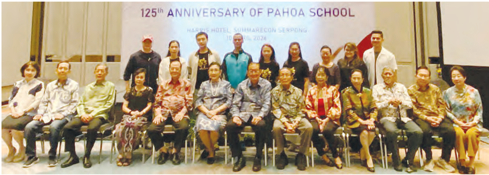
学校领导与三语学校代表晚会上合影。