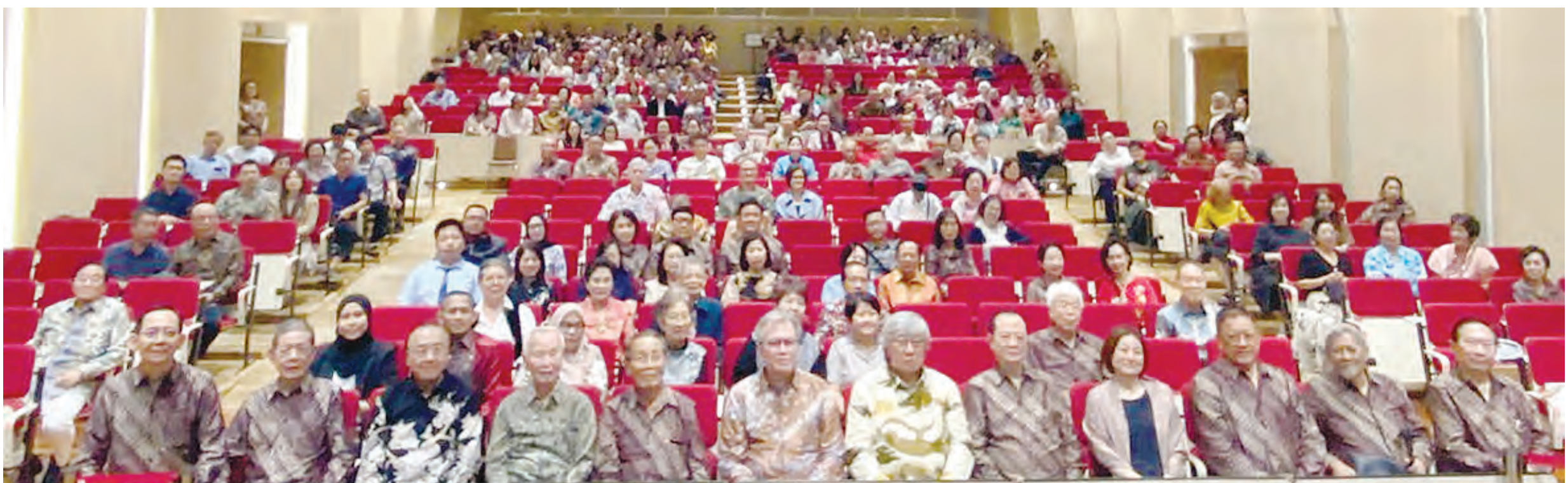
参加座谈会的夹板门合影。