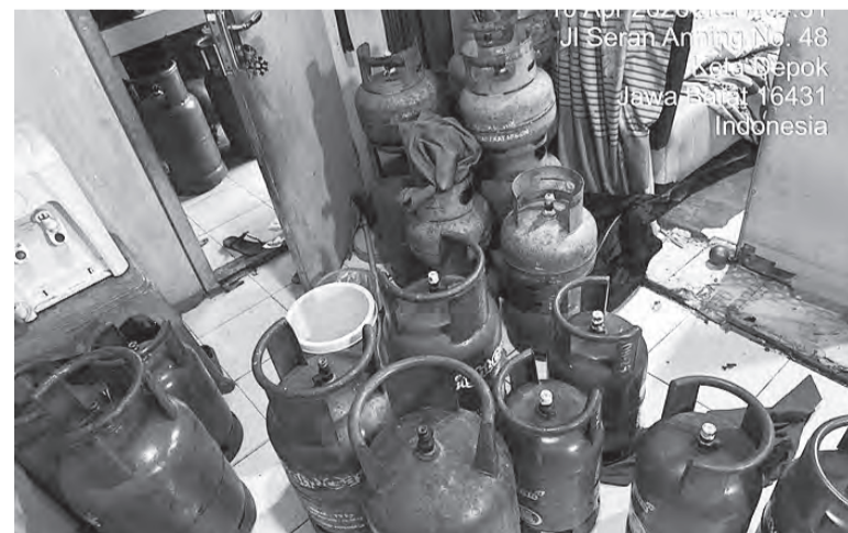
嫌犯将补贴液化石油气注入非补贴液化石油气罐以牟取私利。