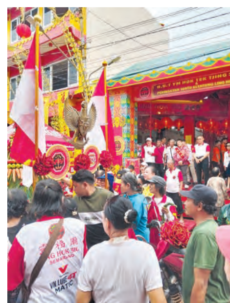
在三宝壟灵福庙前民众争相获取大地之神的恩赐，堆积如山的农产品。