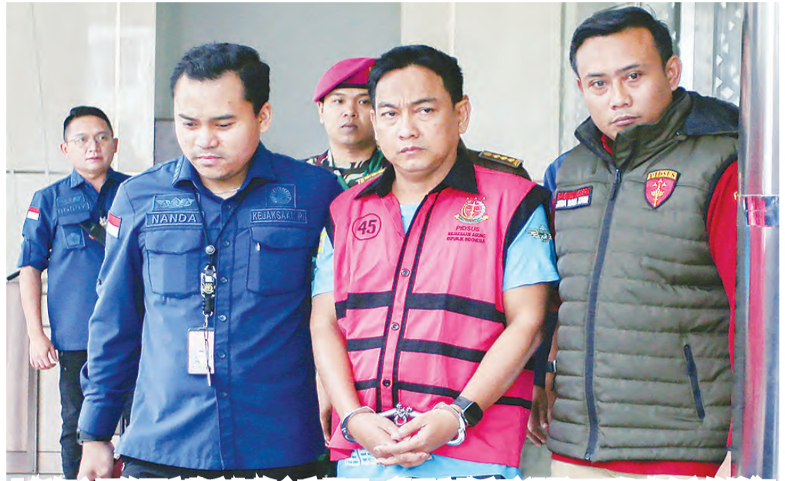
上任仅六天的国家监察机构主席赫里，被最高检察院逮捕及列为贿赂案的嫌犯。

谢里夫表示，赫里涉嫌负责PT TSHI公司的非税国家收入 (PNBP) 的计算。PT TSHI随后要求赫里安排监察专员更正PNBP的计算结果。 “之后，他与HS一起安排国家监察机构监察专员纠正林业部的信函或政策，命令PT TSHI自行计算其应缴纳的税款。”他说。 赫里于印尼西部时间周四上午11时19分，身穿粉色扣留犯衣服，戴着手铐被押送位于雅加达南区副总检察长的最高检察院大楼。 赫里随即被带上一辆囚车。在被押送过程中，他保持沉默。(LCW)