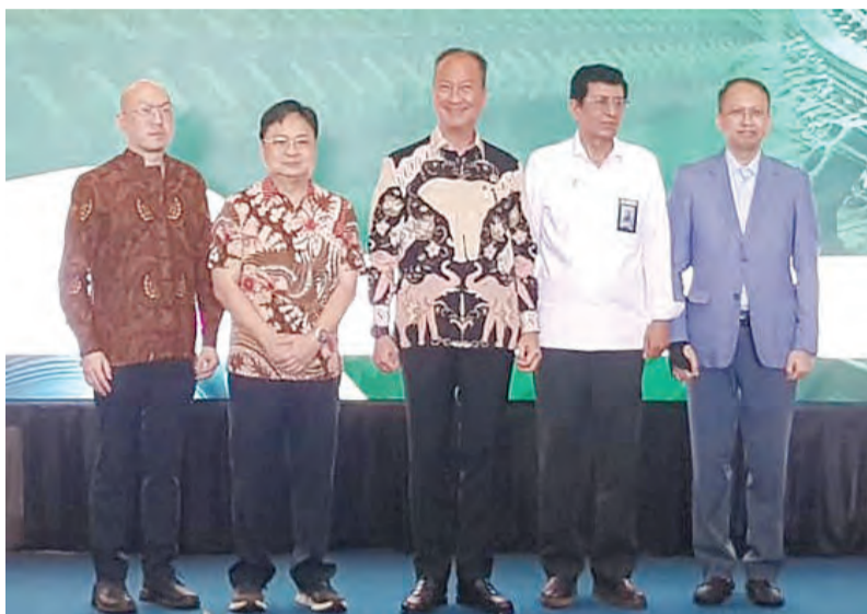
与会嘉宾合影留念。

工业部长阿古斯表示,menegaskan全国纺织工业表现依然强劲。到2025年,该行业年均增长率达3.55%,出口额达