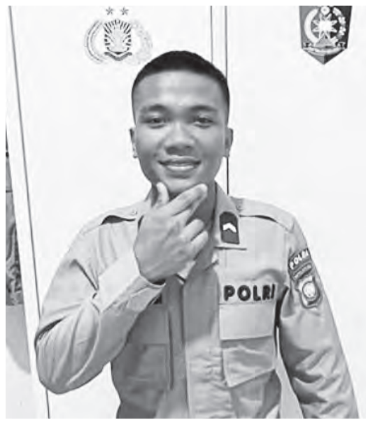
纳塔纳埃尔被发现毙命在警察士官宿舍房间内。