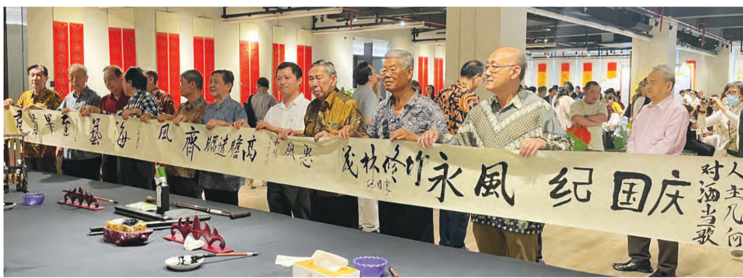
挥毫墨宝的中华文化体验。

士在致辞中表示, 国际中文日作为推动中文国际传播的重要平台, 影响力不断扩大, 中文已成为联通世