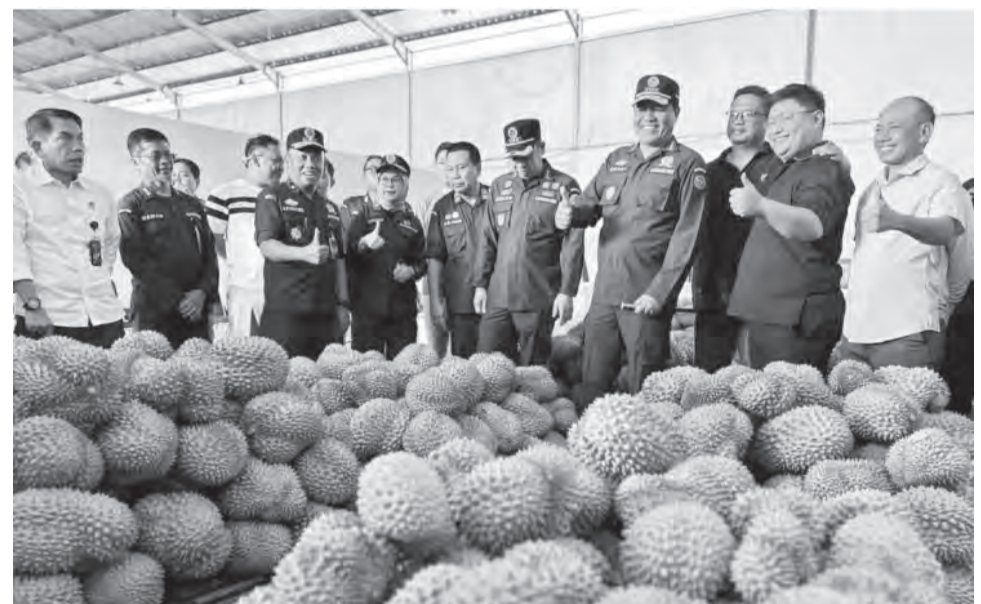
印尼检疫局局长萨哈特视察从巴露市经海运出口印尼榴莲的准备工作。

计局2025年的数据,该省榴莲树数量约为370万棵。其中,120万棵已结果,另有220万棵尚未结果。