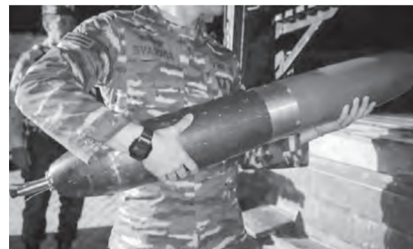
海军带走由渔民发现的一枚疑似飞弹的可疑物体。

针对这项发现,他吁请民众如果发现类似物品,应立即向印尼海军和警方报告,特别是那些可能对当地社区造成危险和致命后果的不明物品。同时,马帕松古(Mappakasunggu)警分署长苏马尔万一级警督察补充说,该物体是在接到渔民举报后发现的。警方随后与塔卡拉尔海军基地指挥