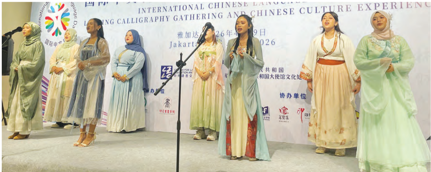
穿汉服的学生演唱。