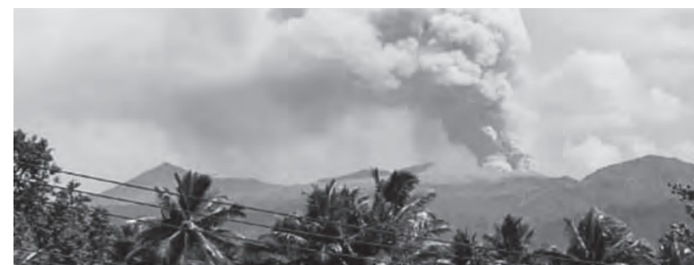
杜科诺火山再次喷发。