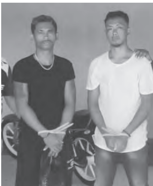
警方逮捕两名嫌犯。