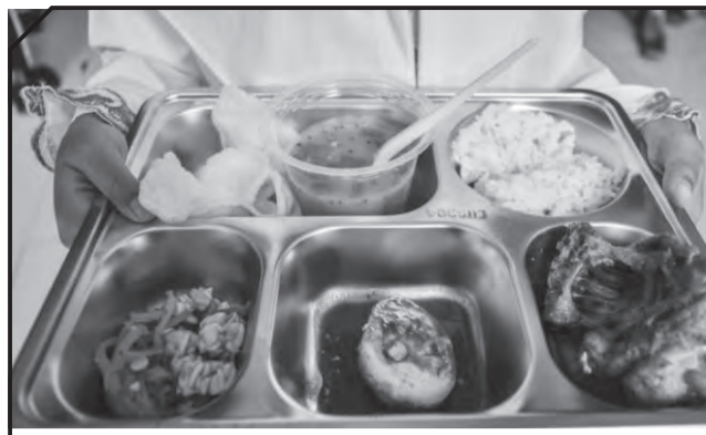
免费营养餐计划为学童、幼儿、孕妇和哺乳期母亲提供免费营养餐。