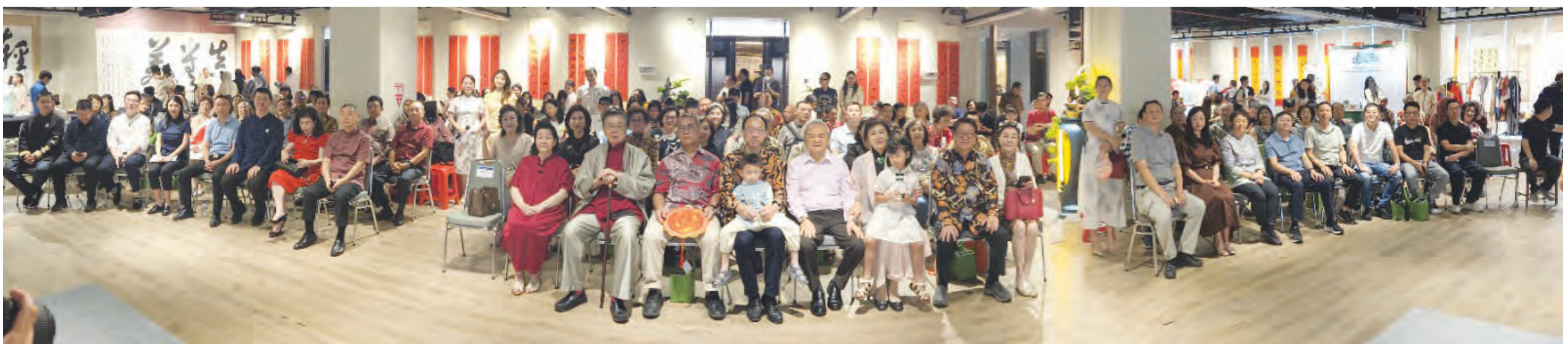
国际中文日的印尼场面。