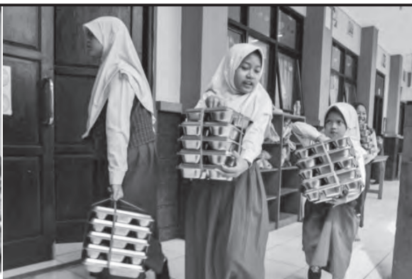
免费营养餐计划再度成为舆论焦点。