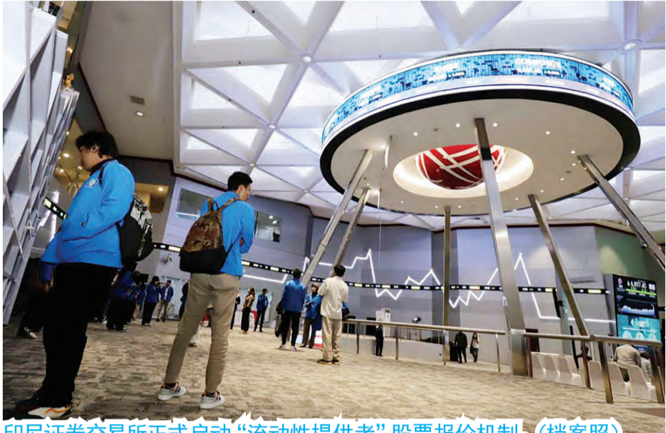
印尼证券交易所正式启动“流动性提供者”股票报价机制。(档案照)

(雅加达讯) 印尼证券交易所 (BEI) 已正式启动“流动性提供者” (liquidity provider) 股票报价机制，旨在提升印尼资本市场的流动性和交易效率。该机制的启动，以交易