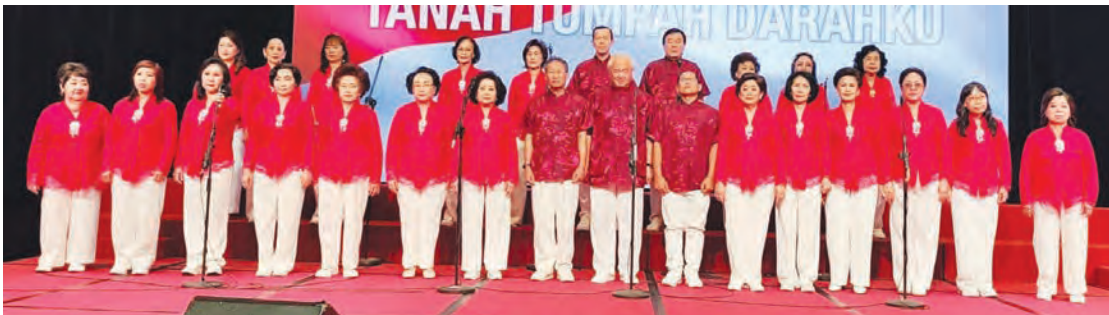
印尼梅州会馆合唱团。