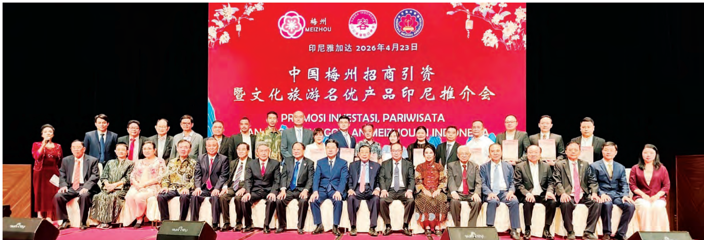
各方代表合影留念。