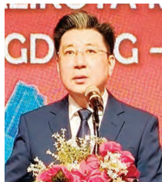
梅州市王晖市长致辞。