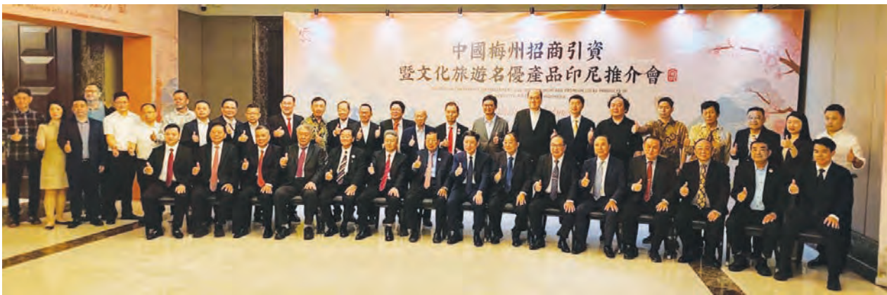
各方代表在推介会现场合影。