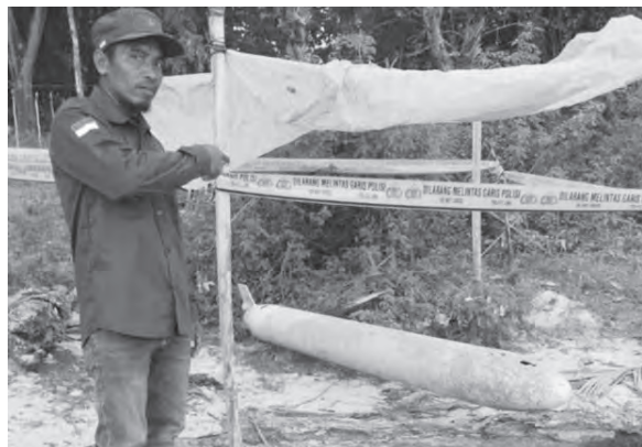
东爪哇省康厄安岛发现疑似导弹物体。

(雅加达讯) 印度尼西亚多地近日接连发现疑似导弹的不明物体, 引发公众对安全问题的担忧, 当局已介入调查。