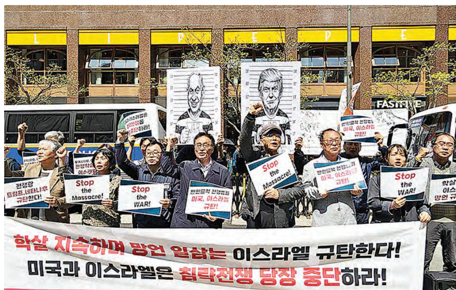
韩国民众集会，抗议美以发动的伊朗战争。