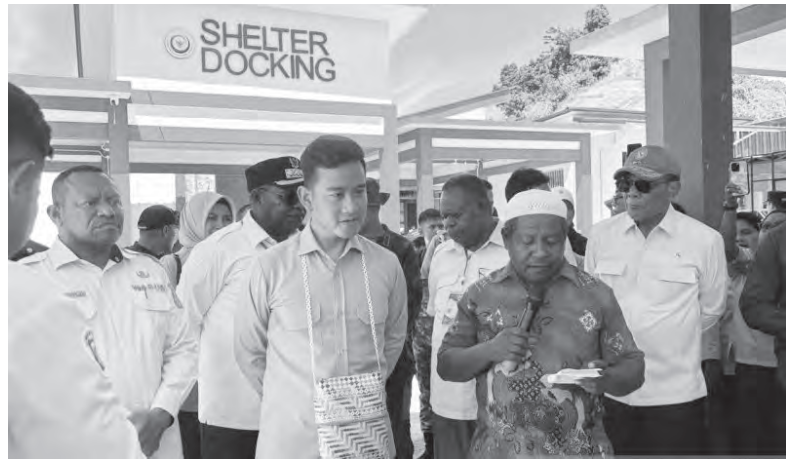
吉布兰视察西南巴布亚省多项政府优先项目。