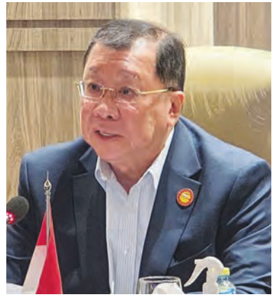
张锦雄总主席致辞。

此外,马来西亚与印尼的经贸合作更是非常紧密,成果丰硕。2025年两国双边贸易额达242.2亿美元,马来西亚对印尼的直接投资达44亿美元,长期稳居印尼前五大外资来源。两国在矿业、清真产业、数字经济、绿色经济等领域的合作持续深化,中小企业往来日益密切,彰显了两国合作的深厚基础与巨大潜力。