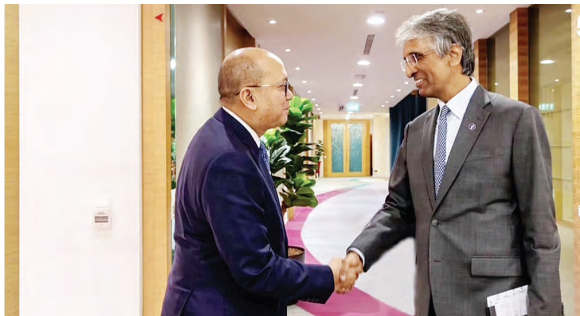
罗桑与淡马锡首席执行官狄澜会晤。

(新加坡讯) 印尼达南塔拉投资管理机构(Danantara)管理层, 访问新加坡政府全资拥有的投资公司淡马锡控股公司(Temasek)。