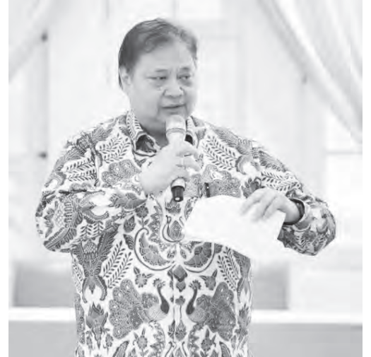
艾尔朗加表示, 摩根大通报告是对政府长期政策选择的认可。