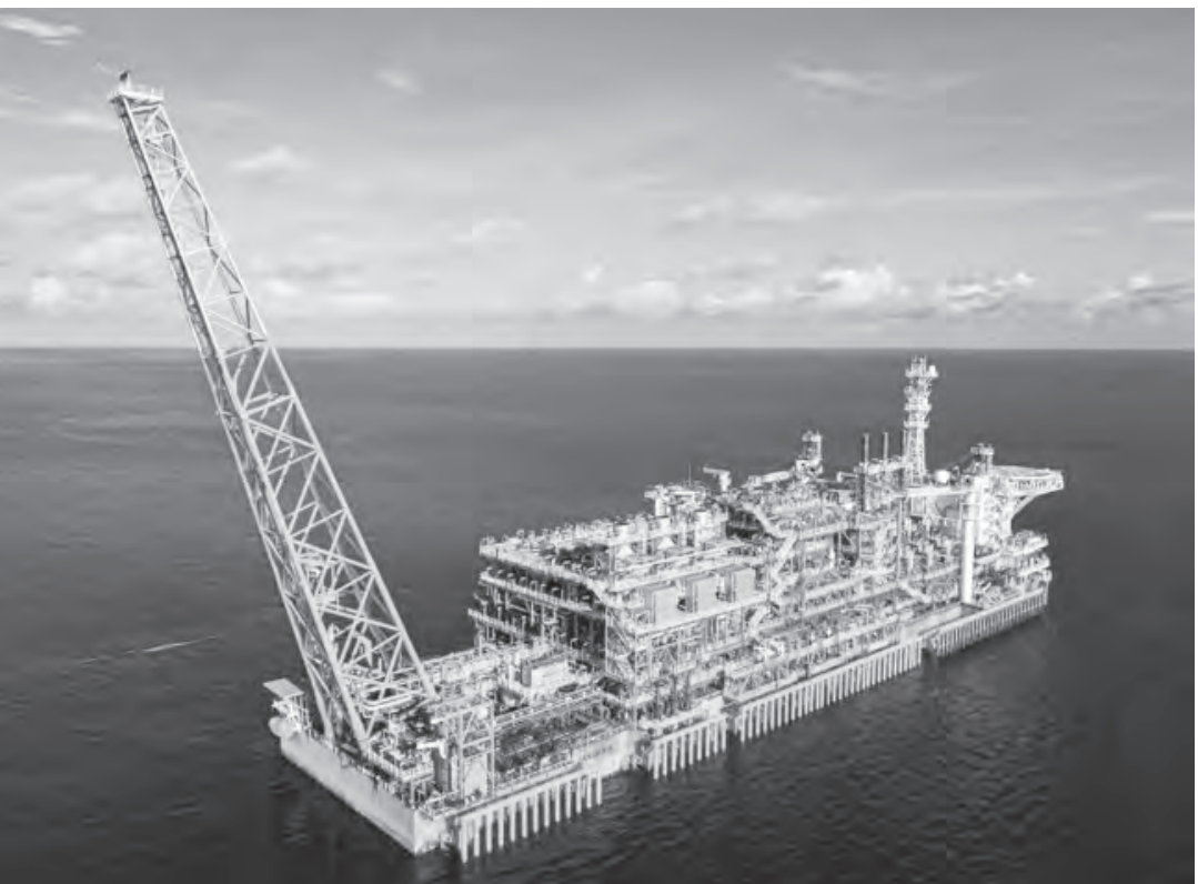
意大利埃尼集团在印尼Ganal区块Geliga-1号探井发现蕴藏量巨大的天然气田。