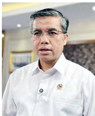
劳工部长亚西尔利。

(雅加达讯) 劳工部长亚西尔利强调, 社会保障的覆盖范围必须扩大至非正规部门劳动者, 包括家政工、网约载客电单车(Ojol)骑士、快递员, 以及渔业和种植业从业者。部长指出, 社会保障是每位劳动者的权利, 必须人人享有, 无一例外。