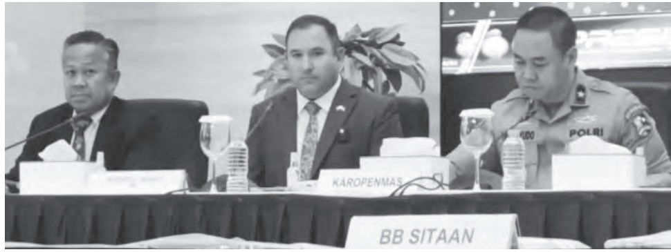
国警刑事调查局与美国联邦调查局召开联合新闻发布会。

(雅加达讯) 印尼国家警察刑事调查局 (Bareskrim) 与美国联邦调查局 (FBI), 将绘制与东努沙登加拉省一对情侣出售骇客工具或钓鱼网络诈骗工具 (phishing tools) 相关的网络犯罪生态系统图。警方目前正在鉴定数千名分布在多个国家的脚本 (skrip) 购买者。