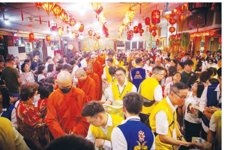
信众们向僧伽献上供品。