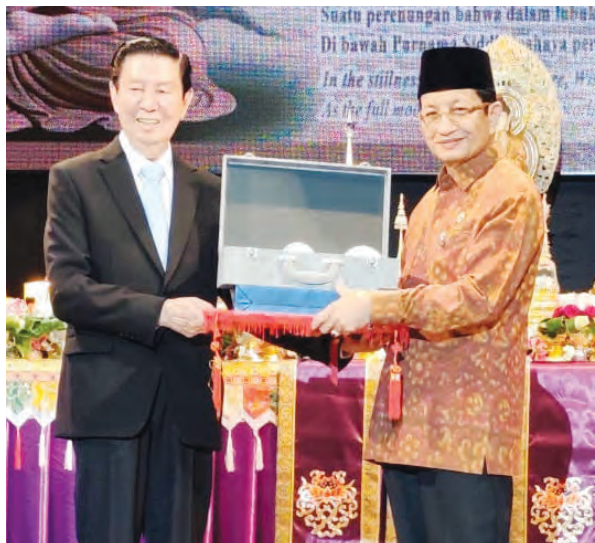
俞雨齡主席(左)贈送紀念品給Nasaruddin Umar部長。