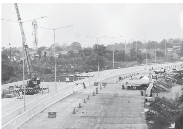
工程部加快建设途经巴隆的塞尔榜-茂物高速公路。

的印尼基建担保公司（PT PII）曾为政府与企业合作（KPBU）计划下的道路基础设施项目之一即是茂物-塞尔榜高速项目提供担保。