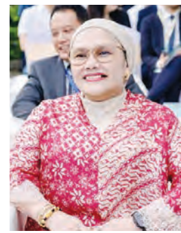
印尼驻广州总领事馆代总领事Andalusia T.T Dewi。

次签约仪式由印尼驻广州代总领事及多国使节共同见证，为中印尼两国医疗互通、技术共享、双向转诊、人才交流奠定了扎实的合作基础。