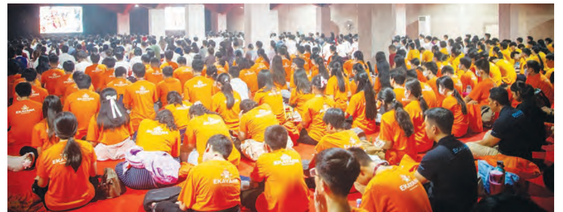
通过视频参加法会。