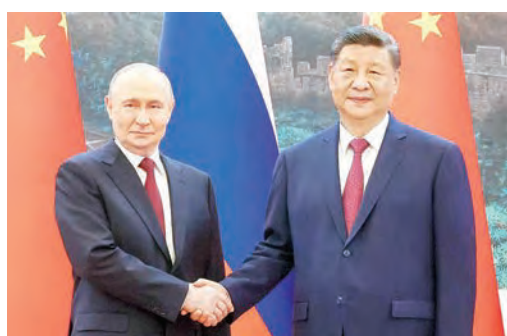
普京（左）与习近平：中俄携手面对日本新军国主义崛起。