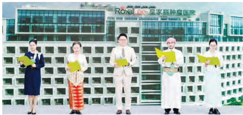
国际医疗中心员工多语种诗朗诵表演。