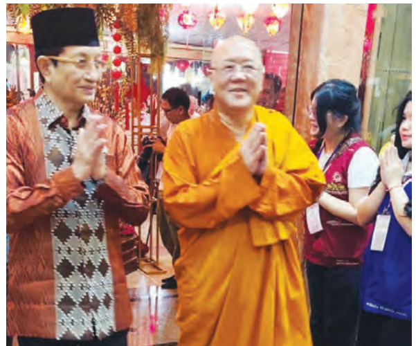
Nasaruddin Umar部长(左)与释定净法师(右)步入活动会场。

部长说,今天那么多海内外大德的到来,证明佛法是全球的。我们大家都是一个人,因为卫塞节可以变成一个机会,让我们一起燃和平之灯。印尼宗教之间的和平度在2025年是达到最高的,愿这个盛世能够一直持续下去。最后祝大家卫塞节快乐,愿一切众生离苦得乐,阿弥陀佛。