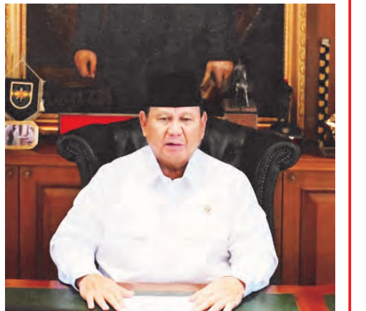
普拉博沃通过视频发表卫塞节献词。