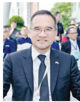
Kajititi Wihatwanont 总领事。