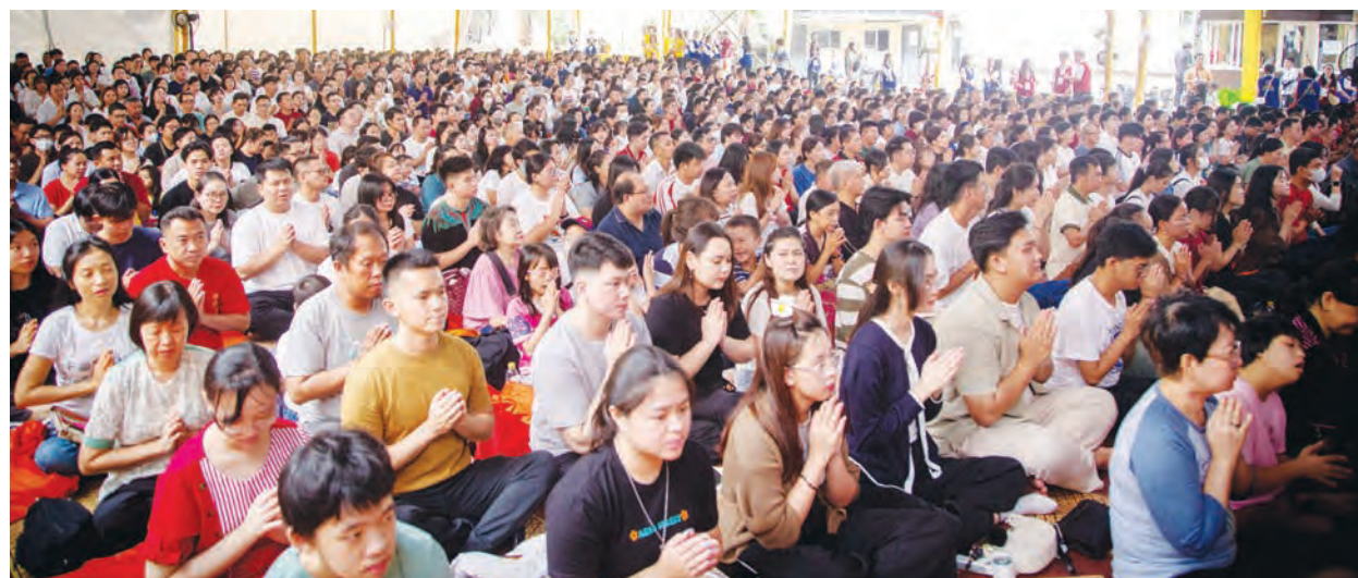
参加卫塞节祈福法会的部分信众。