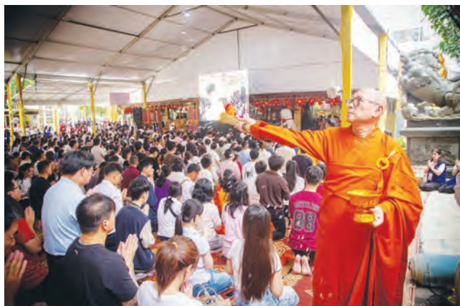
法师向信众撒净水。