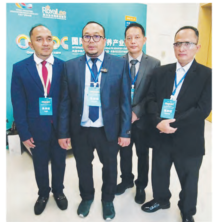
印尼穆罕马迪亚大学医院代表团接受采访。