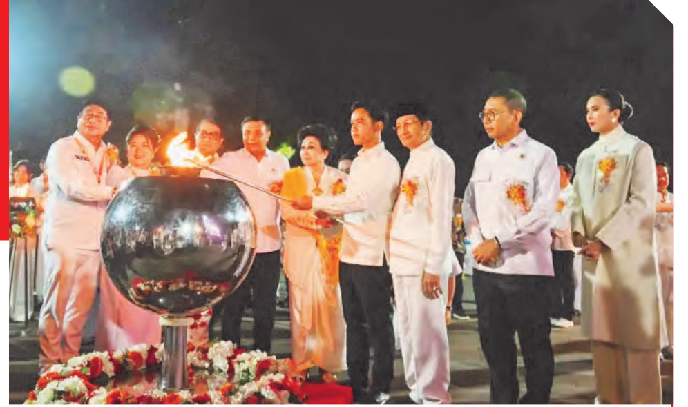
吉布兰副总统(右四)主持全国卫塞节庆祝活动开幕仪式。

升的精神以及向他人传播善意与和平的决心。这个仪式是今年卫塞节纪念活动中最具意义的高潮之一。