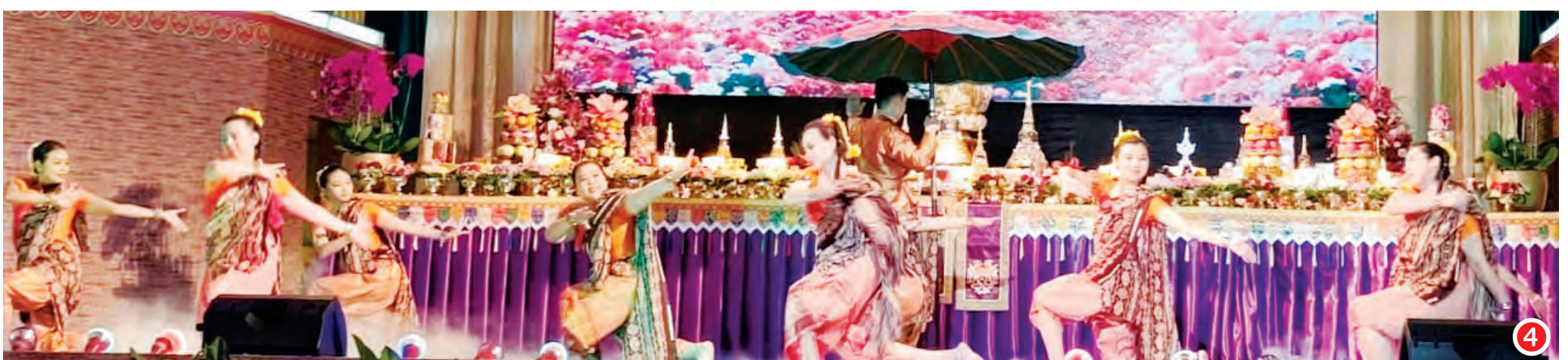
④ 衛塞月圓佛教舞蹈。