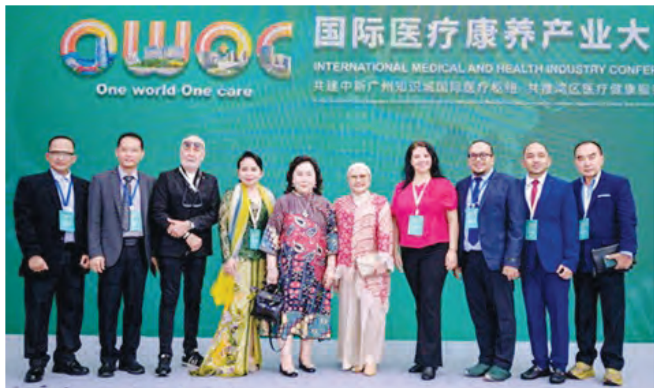
各方代表合影留念。