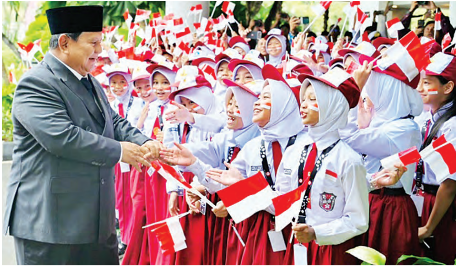
普拉博沃与出席班察西拉建国五原则诞辰纪念仪式的小学生握手问好。

“我们可能会遭到那些不愛我们国家的人的抵制，他们甚至还在试图削弱印度尼西亚共和国的统一国家地位。但一个伟大的国家必须勇敢。我们必须有勇气做出正确的决定，即使这些决定很艰难。我们必须有勇气捍卫我们的人民。”普拉博沃说道。