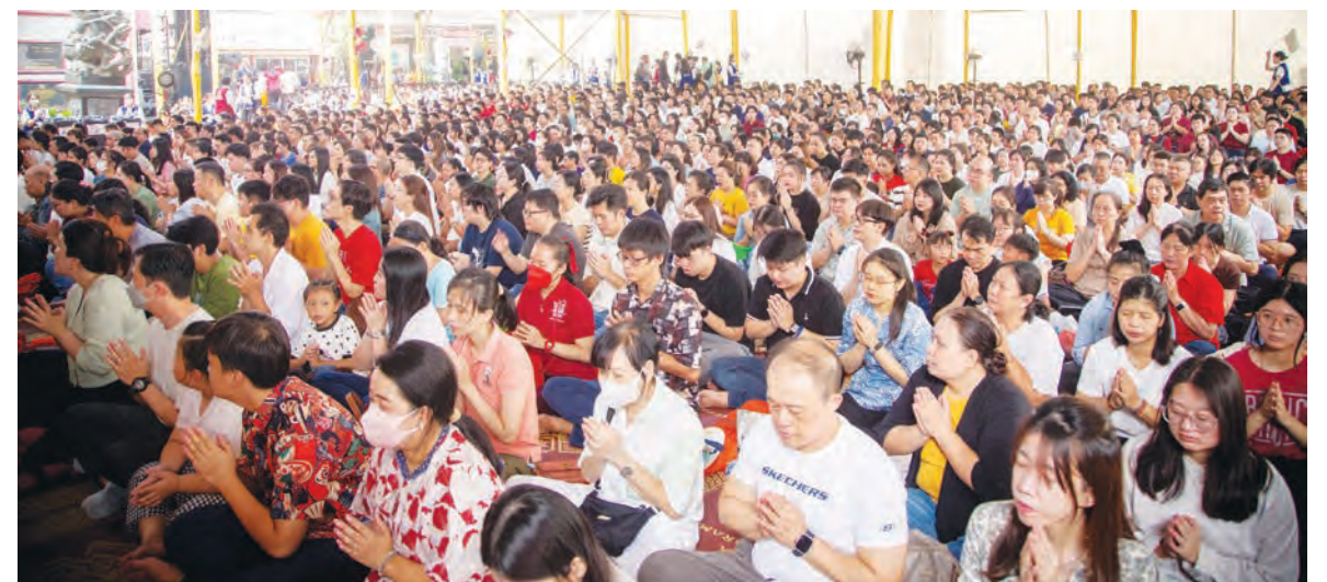
参加卫塞节祈福法会的部分信众。