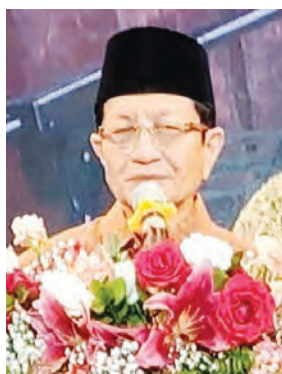
印尼宗教部長 K.H.Nasaruddin Umar致辭。

首先由佛誕衛塞節全球僧伽通過視頻佛法祝賀。籌委會主席俞雨齡在致辭時表示，佛曆2570年/公元2026年全球衛塞慶祝大會在印尼雅加達舉行。自聯合國教科文組織於1999年將衛塞節設立為國際紀念日以來，這項已舉辦16屆的慶典旨在邀請世界各地的比丘僧團齊聚一堂，傳遞和平的信息。衛塞月本身就蘊含着崇高的意義——它散發着最完美的光芒，為包括我們摯愛的祖國印度尼西亞在內的世界各地帶來清涼與和平。