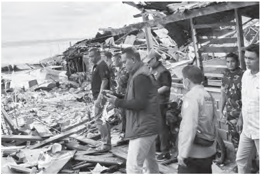
警方在爆炸现场展开调查。

（巴布亚讯）巴布亚省比亚克努姆福尔县（Biak Numfor）于5月31日（周日），发生疑似二战遗留炸弹爆炸，造成5人死亡，3人失踪。