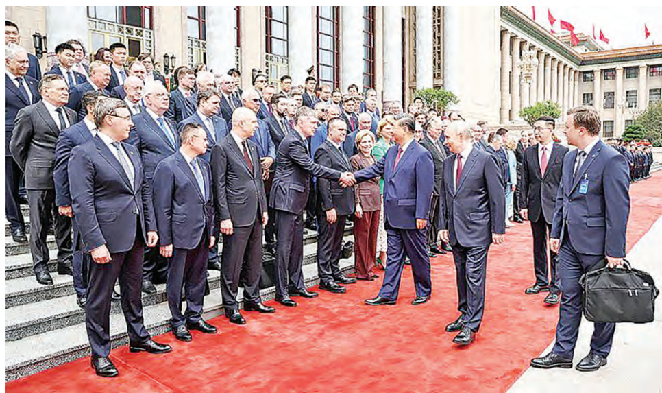
习近平接见俄罗斯访问团成员：成员包括高官和商界精英。