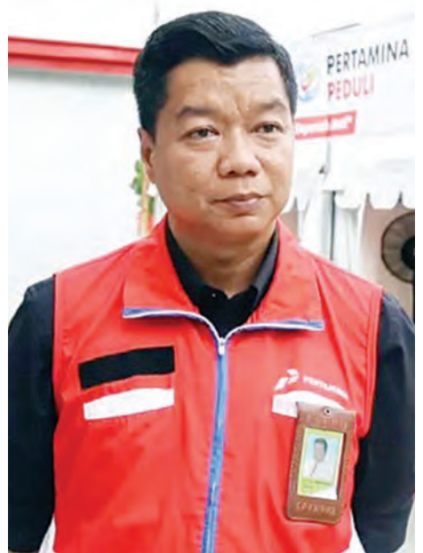
罗伯特指出，航空燃油价会根据法规每月定期调整。

每年6月1日是印尼建国五原则纪念日，是为了纪念苏加诺总统于1945年6月1日在印尼独立筹备工作调查委员会(BPUPKI)会议上发表的关于国家基本理念“班察西拉”(Pancasila)的演讲。(LCW)