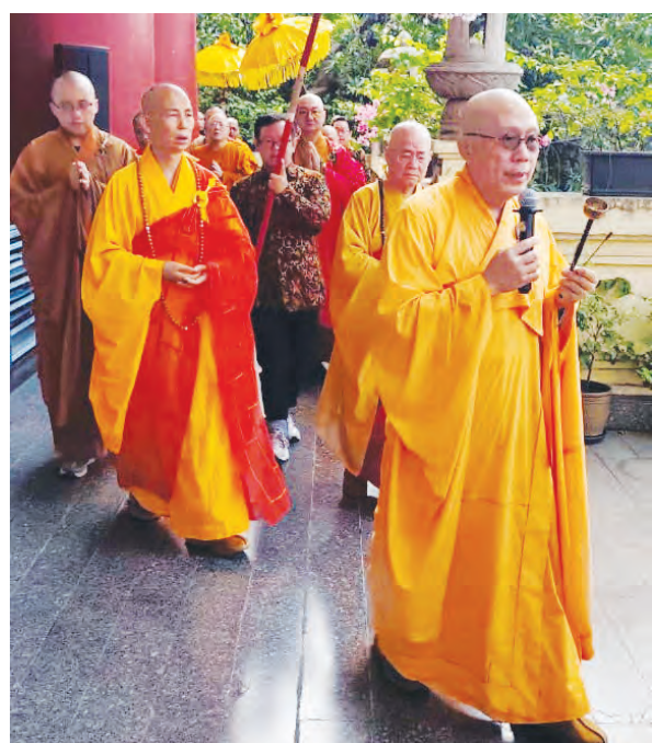
僧伽們誦經步入活動會場。