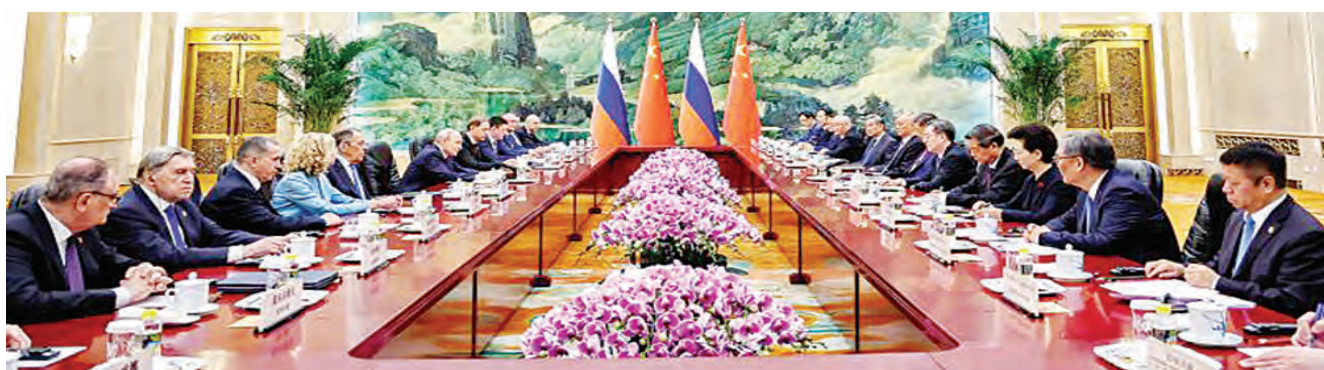
中俄高层官员会议：《中俄睦邻友好合作条约》二十五周年。