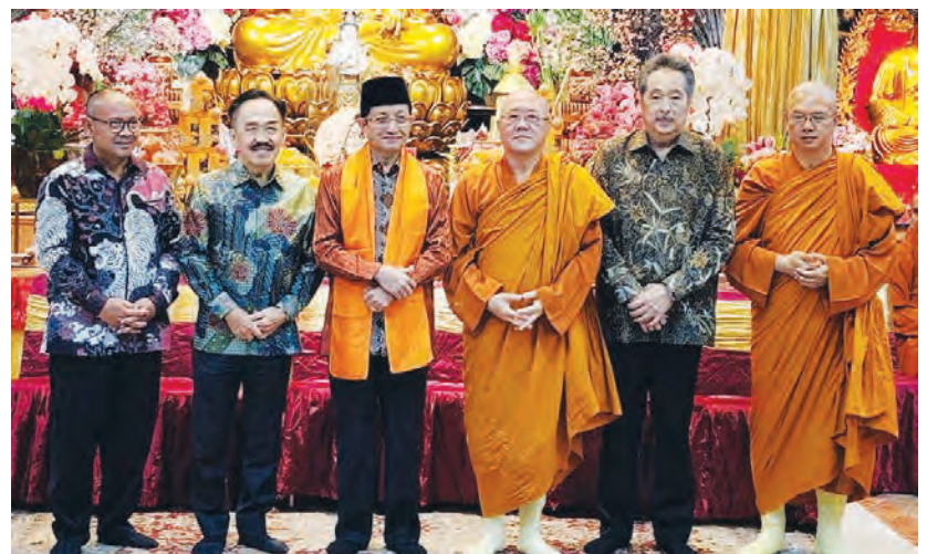
释定净法师(左四)赠送哈达给Nasaruddin Umar部长(左三)后与嘉宾们合影。