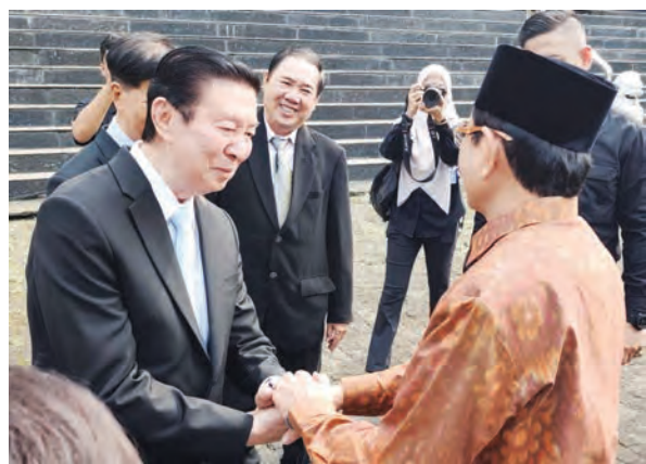
俞雨齡主席(左)歡迎Nasaruddin Umar部長蒞臨。