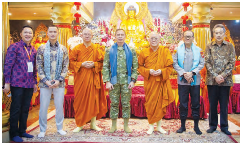
释定净法师(右三)赠送哈达给Deddy Suryadi中将(右四)等嘉宾后合影。