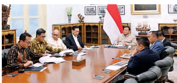
国家经济委员会向普拉博沃汇报关于免费营养餐纲领的独立调查结果。

塞普蒂安称, 这些研究结果表明, 免费营养餐纲领项目不仅有助于改善印尼儿童的营养状况, 还鼓励形成由当地企业家的新型供应链。国家经济委员会还指出, 参与免费营养餐配送服务单位的中小微企业中, 约有65%来自与营养餐配送服务单位所在地相同的地区。