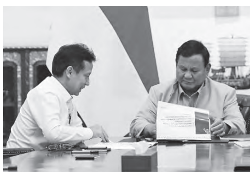
卫生部长布迪向普拉博沃汇报卫生项目的具体实施成果。

内阁秘书强调，所有这些举措都体现了普拉博沃总统的发展愿景，即国家发展不仅追求经济增长，更要通过扩大住房获取渠道，直接改善人民生活水平，让发展成果惠及更广泛民众。