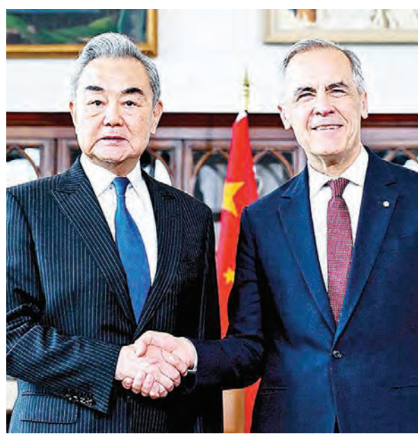
中国外长王毅(左)与加拿大总理卡尼。

加拿大总理卡尼推动对华破冰。中国外长王毅十年来首访加拿大，双方就扩大贸易达成共识。卡尼公开力挺人民币国际化，借中国制衡特朗普压力。