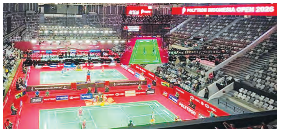
夜间色彩缤纷的 Istora Senayan。

他说，“羽毛球在印尼是一项具有凝聚力的运动。汇丰银行对 2026 年印尼公开赛的支持，体现了该行致力于与社区建立联系、支持积极健康的生活方式，并通过世界级体育赛事回馈客户忠诚度的承诺。”