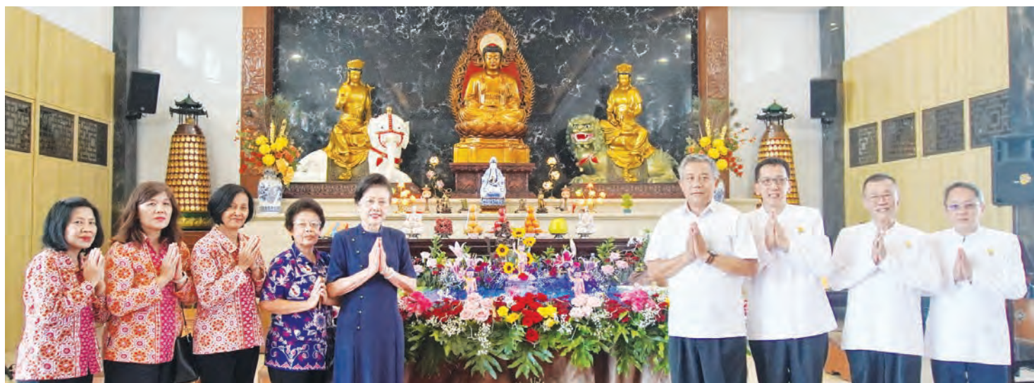
佛堂代表、慈济师姐、佛教司代表合影。