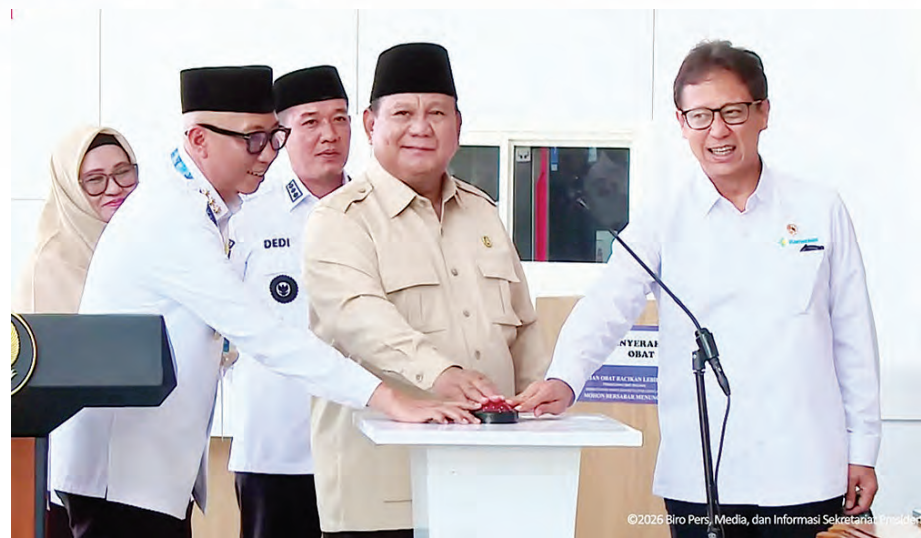
普拉博沃(右二)主持穆罕默德·托希尔地区综合医院揭幕。右为卫生部长布迪。