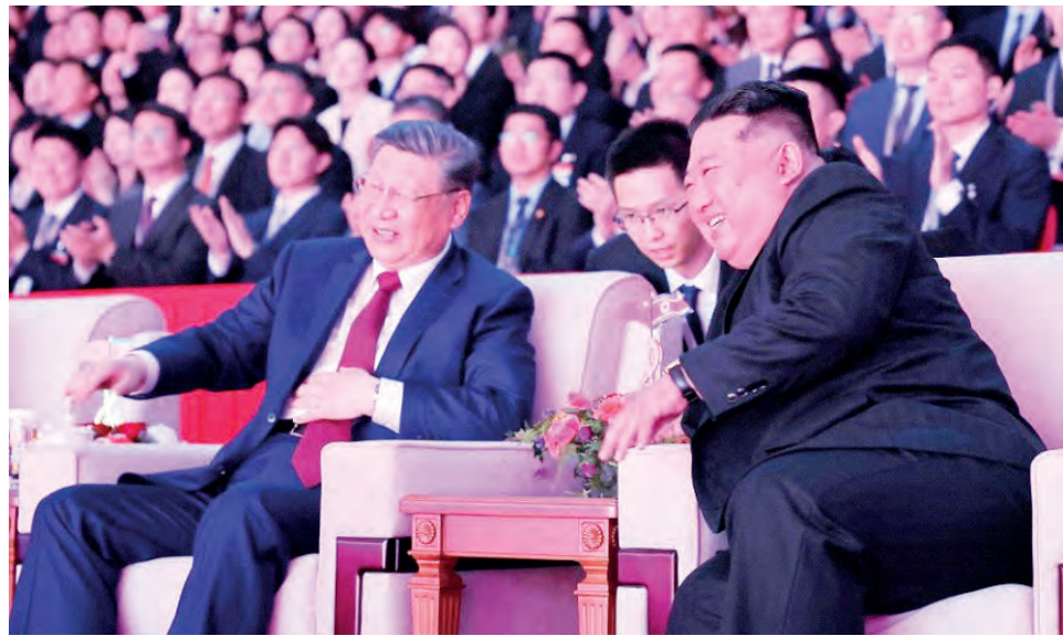
(平壤讯) 朝鲜官媒周三详尽报导了中国国家主席习近平访朝的第2天行程, 大力渲染和突显朝中