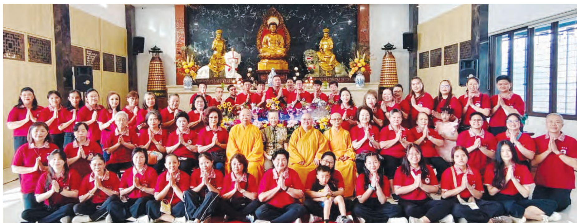
万年堂住持、僧团、众师姐、师兄大合照。