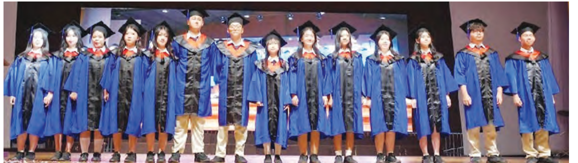
准备远赴中国深造的毕业生。