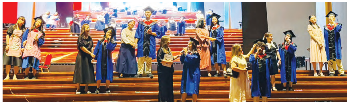
家长与孩子们同台表演《陪我长大》。