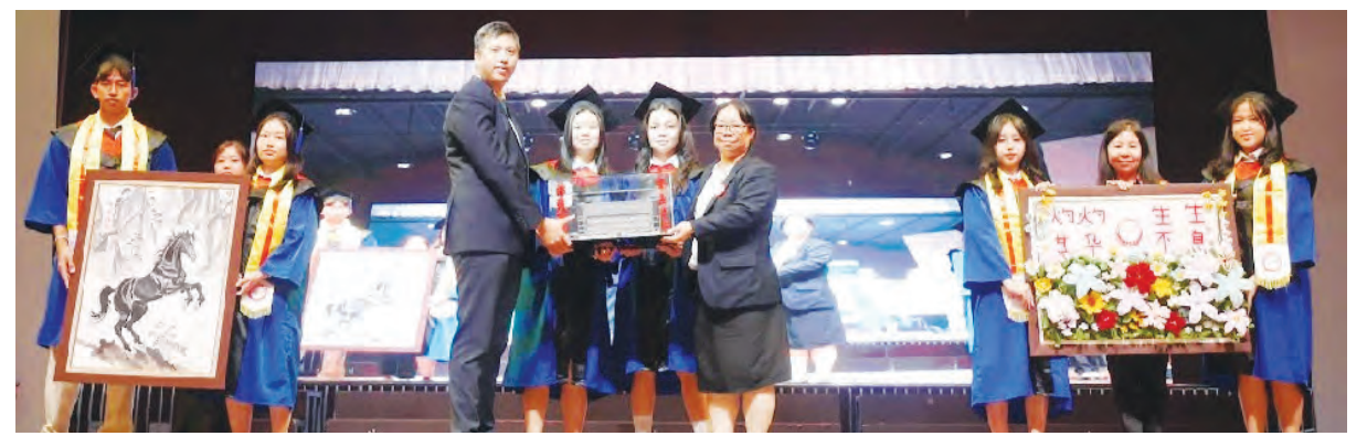
毕业生给母校赠送纪念品。