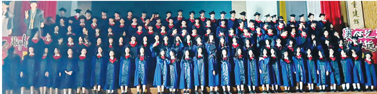
毕业生演唱《裹着心的光》。