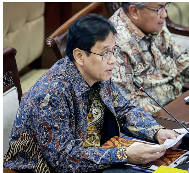
普尔巴亚出席与国会第十一委员会的工作会议。

(雅加达讯) 印尼政府正通过“促增长、促民生”(pro growth-pro welfare) 战略, 力求在2027年实现国家经济增长。