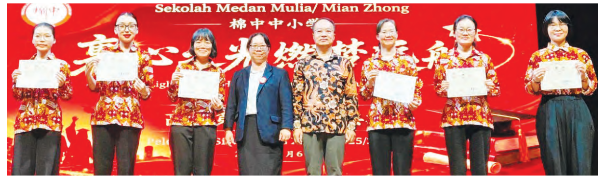
黄河总领事为棉中中国老师颁发感谢状。