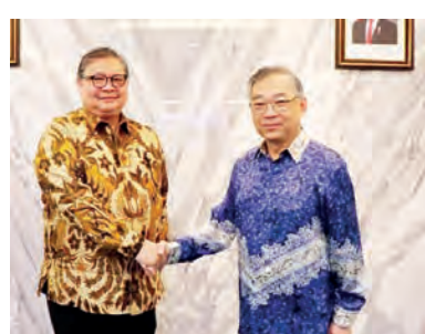
艾尔朗加与颜金勇会晤。

全球局势不明朗的情况下, 也致力于维持贸易畅通的共同承诺。双方探讨了深化企业间合作, 以及扩大对两国经济至关重要的领域的投资的机会, 这些领域包括数字经济、绿色经济、工业基础设施和农业技术。