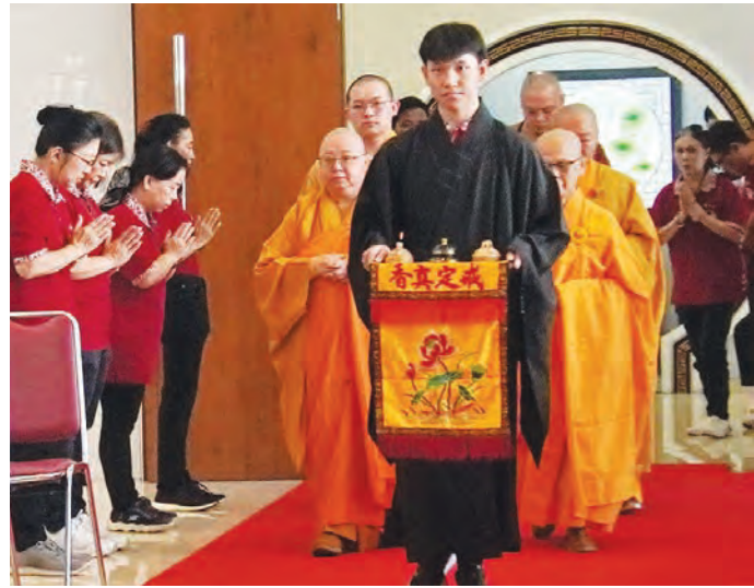
青年师兄手捧“戒定真香”请师旗引领法师进场。

(万隆讯) 万隆万年堂于今年6月7日举办卫塞节庆典, 恭请贤善法师主法。几百名来自各庵堂寺庙、佛教团体及各地善男信女在登记处奉献, 获得一株玫瑰花, 以花供佛, 一起敬虔见证并参与诵经浴佛。