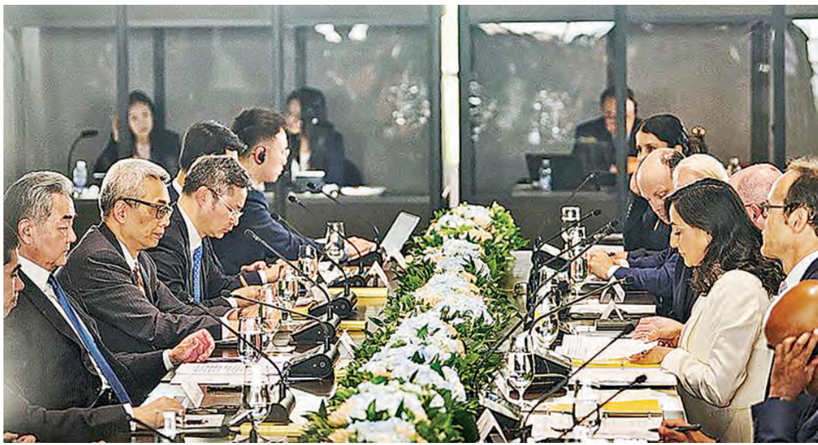
中国外长王毅(左一)与加拿大外长阿南德(右三)在渥太华：加中破冰。

因此，卡尼算准王毅去联合国开会的时机，单枪匹马杀进美国金融中心纽约，直接向华尔街投资者喊话，强调加拿大的制度稳定跟特朗普的不靠谱恰恰形成反差，华尔街也应该采取多元化投资，把一些鸡蛋放进加拿大的篮子里。但是，谁也没有料到，卡尼在纽约不但大谈他的破冰