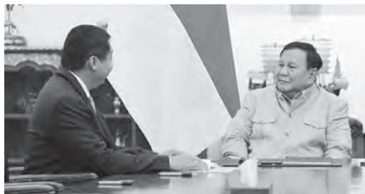
普拉博沃听取房屋部长马鲁拉尔汇报多项优先住房计划的进展报告。

罗伯特指出，调整燃油价格是公司确保能源供应持续稳定、向公众提供优质燃油产品的重要举措之一。公司将持续保障全国范围内燃油产品的供应与质量，同时确保对公众的服务保持正常运行。