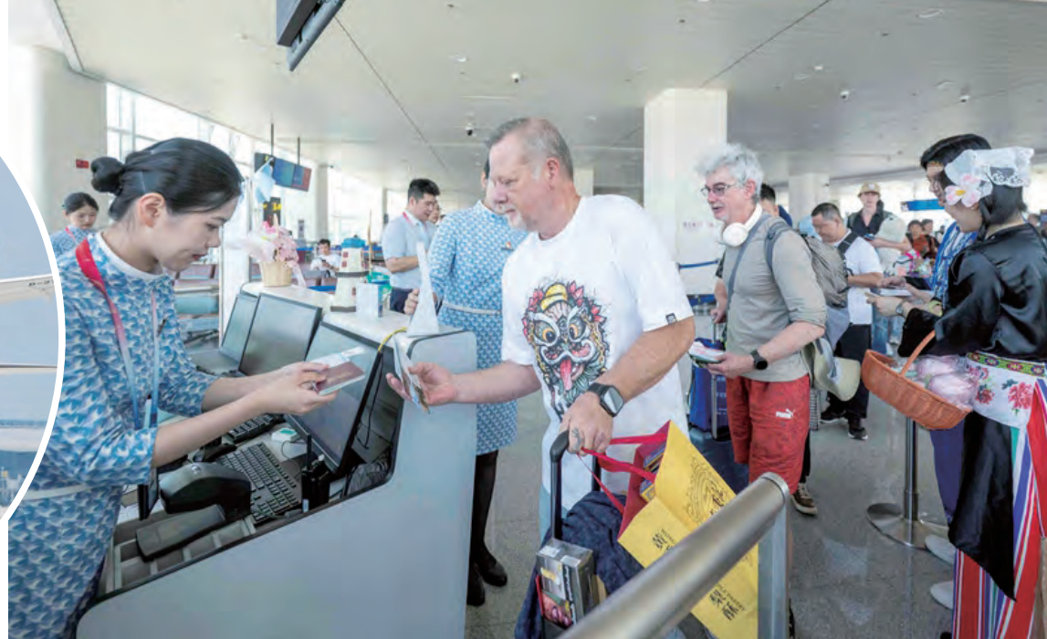
福州—阿姆斯特丹首航航班旅客有序登机。

(福州25日讯)23日上午,随着福州长乐国际机场二跑道正式投运,以及福州往返荷兰阿姆斯特丹直飞航线首航,福州机场成为福建省首座、中国第17座4F级机场,正式迈入“双跑道时代”。与此同时,T2航站楼正加紧联调联试,计划于今年内投入运行。这座总投资约220亿元的二期扩建工程,正加速将福州长乐国际机场推向“面向国际、面向海丝、面向两岸”的区域枢纽机场新高度。