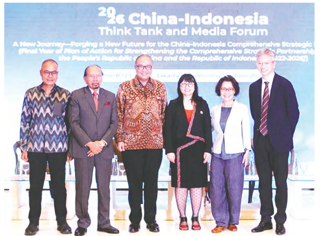
王鲁彤大使(右)与出席中国-印尼媒体与智库论坛嘉宾合影。(新华网图)

费营养餐计划的管理效率。 目前，印尼政府正在打造一个数字化生态系统，用于整合各部委和政府机构的数据资源，以加强对各项政府项目的监督和评估。 卢胡特说：“例如在免费营养餐计划中，通过数据分析，我们可以判断哪些地区需求更大，哪些地区可以列为第二优先级，从而提高政策执行效率。” 除免费营养餐计划外，人工智能技术还将被应用于社会救助项目。 免费营养餐计划是普拉博沃政府的重要民生项目之一，旨在改善学生和儿童营养状况，而人工智能和政府数字化治理技术的引入，被视为提升项目效率和可持续性的关键工具。