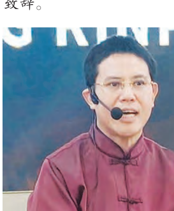
仁波切主讲在现代生活与传统美德之间取得平衡。