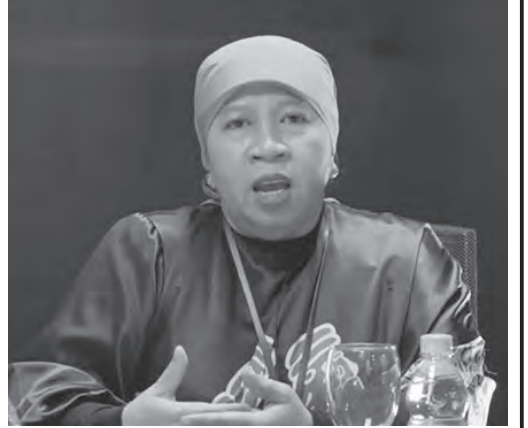
英格表示，并非所有卖家都需要缴税。

英格确认，并非所有通过网店销售商品的卖家都需要缴税。年营业额低于5亿盾的卖家可免于平台代扣代缴税款。但年营业额在5亿至48亿盾