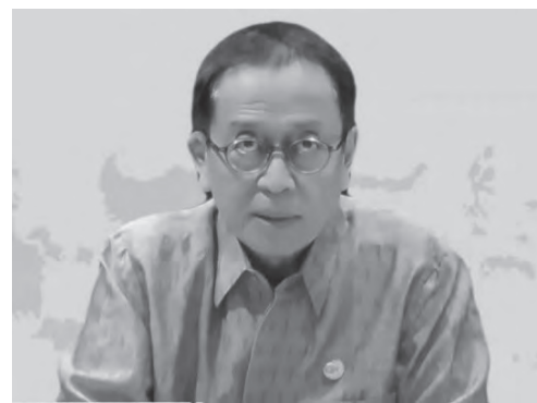
迪安表示，加强银行的主要流动性来源重要。