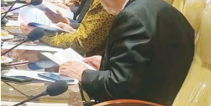
双方代表交流现场。