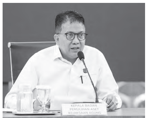
昆塔迪表示，实施多项政策加快处置被没收资产。

(雅加达讯) 最高检察院 (Kejagung) 资产追回局 (BPA) 透过追踪、没收和管理犯罪所得资产，在2025年全年向国库返还了19兆6000亿盾的资产。资产追回是执法工作的重要一环。