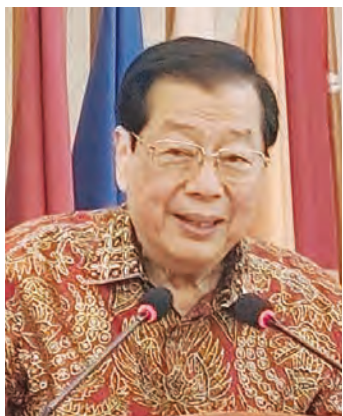
印尼客总叶联礼总主席致辞。