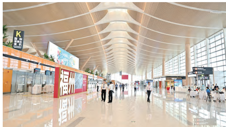
福州长乐国际机场T2航站楼。