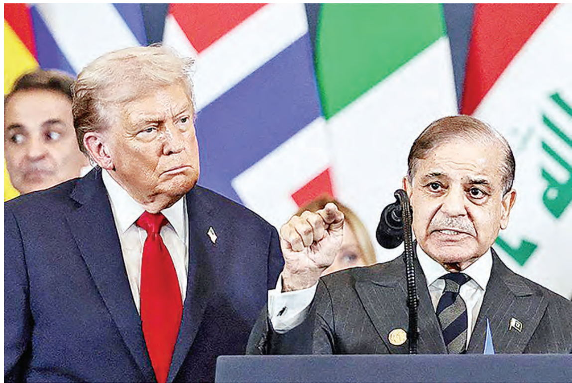
特朗普（左）与巴基斯坦总理夏巴兹：调停美伊战争。

家的巴基斯坦出面调停，才给了特朗普一个台阶。由於无法逼伊朗签下「城下之盟」，伊朗主和派在革命卫队强硬派坚持下，无法满足美方终战要求，谈判近一个月并无关键交集；至於军事封锁霍尔木兹海峡的行动，短期难以奏效。虽然国际社会和华尔街股市都认定特朗普是「TACO」（Trump Always Chickens Out，特朗普总是临阵退缩），但海峡始终无法安定，国际油价起伏，包括美国在内的主要经济体都面临通胀压力，美联储新任主席亦不敢一味唯特朗普马首是瞻而贸然降息，导致华尔街股市上周巨幅波动。特朗普为「救市」再度祭出战争手段，对伊朗进行两天空袭，并暗示派地面部队占领伊朗石油命脉哈尔克岛；就在第三天「毁灭攻击」前夕，特朗普突然取消攻击，称谈判出现「戏剧性逆转」。如此股市大幅反弹，连带推高马斯克旗下SpaceX的估值，尽管诺贝尔经济学奖得主克鲁曼称马斯克是庞氏骗局。但毫无疑问，这个「极限施压」失败下的终战条款，绝非美国胜利的产物。