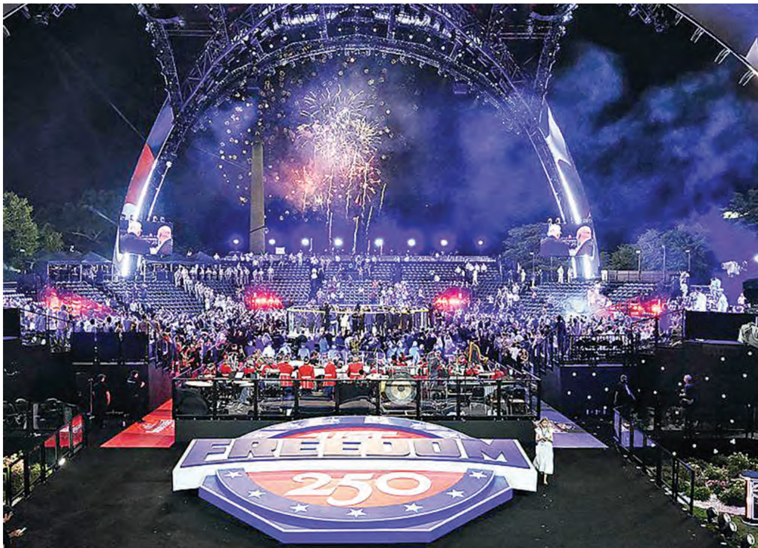
UFC Freedom 250赛事：白宫史上首次举办格斗比赛。

由此可见，这场战争的荒谬性将随终战愈发呈现。但进入八十大寿的特朗普，根本不会反省自己的荒唐与任性——他竟在白宫战情室提出使用小型核武，充分暴露其疯狂一面。如今被迫妥协，实因他违背MAGA不发动海外战争的承诺而轻率动武，带来油价上升和通胀威胁，已影响基本盘选民，中期选举败选概率急升。他虽然在共和党参众两院初选击败「不忠诚者」，却引发党内焦虑，多项议案上跟他唱反调。内外交困之下，为终止战争制造「生日惊喜」，他将「美国优先」演绎为「特朗普优先」，国家利益沦为为他自我陶醉的筹码，这是美国的不幸，也是世界的幸。内塔尼亚胡给世人做了警示：想利用特朗普者，终必为特朗普所弃。■