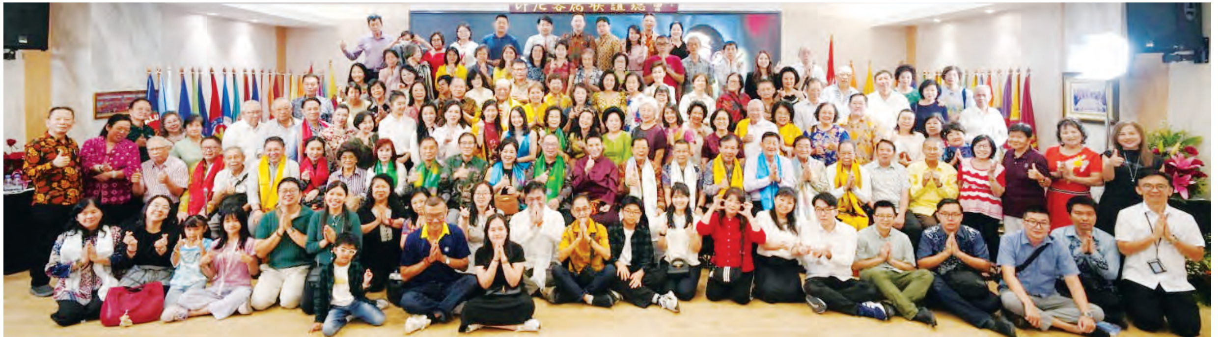
座谈会结束后与会者合影留念。