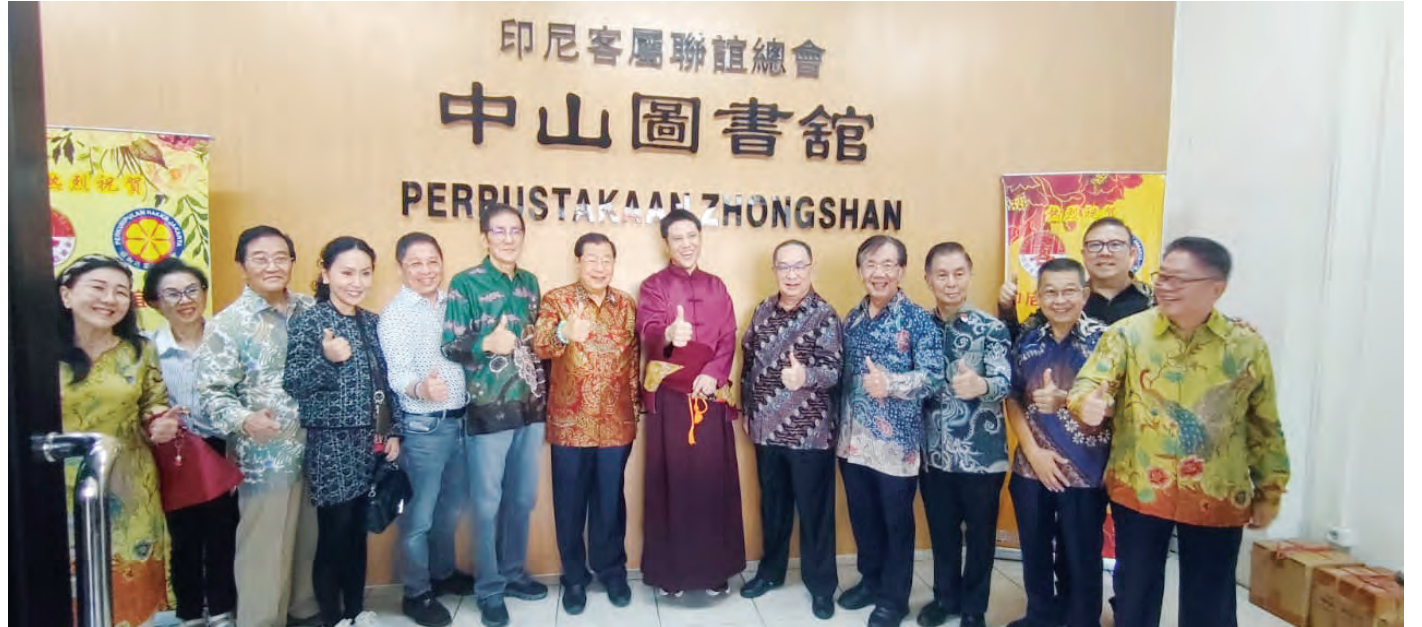
仁波切 (左八) 与客属乡亲在中山图书馆合影。