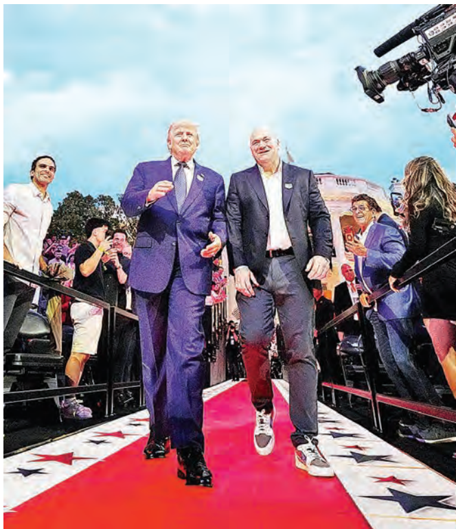
美国总统特朗普（左）与UFC总裁兼执行长达纳·怀特（右）出席白宫UFC赛事。