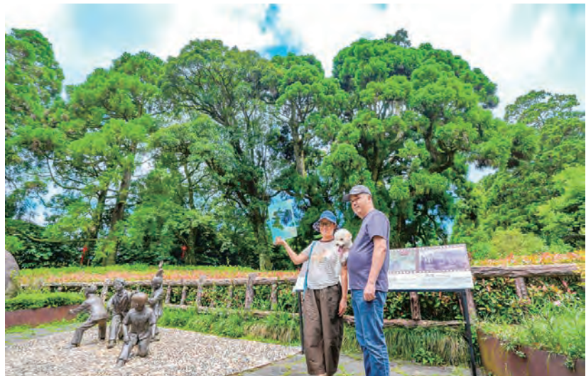
游客在柳杉王公园打卡点留影。

(福州25日讯)19日,由鼓岭管委会、福州日报社联合主办的“百年鼓岭·光影耀榕城”主题摄影展第一篇章“鼓岭故事·避暑文化生活展”在鼓岭启幕。