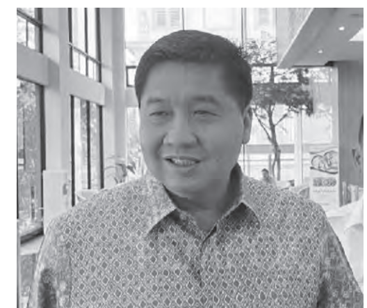
马鲁拉尔表示，正在设计融资方案。

马鲁拉尔认为，维持5%的贷款利率体现了政府对普拉博沃总统扩大民众获得补贴住房机会这一旗舰计划的持续支持。