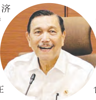
卢胡特表示，政府目前被迫解决各种问题。

(雅加达讯) 国家经济委员会(DEN)主席卢胡特透露了免费营养餐(MBG)纲领实施过程中存在的一些问题，尤其是在落后、边远和外围地区(3T地区)。 卢胡特表示，这是他在与国家营养局(BGN)两位副局长阿古斯蒂娜与特伦戈诺会面后，得出的结论。 卢胡特于6月25日(周四)在雅加达中区国家经济委员会办公室举行的“法治与经济增长”研讨会上表示，尽管该纲领已获得预算拨款，但在许多3T地区，免费营养餐的实施进展并不顺利。 他说：“既然事情已经发生，就不能简单地削减预算，因为之前提到的在许多3T地区的免费营养餐纲领存在问题，实际上，资金已经花掉了。” “那我们该怎么办？如果我们想对此大做文章，只会徒增麻烦。所以，我们必须始终思考如何为我国找到最佳解决方案。”