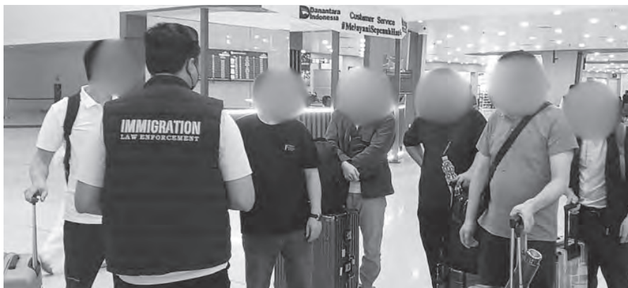
泗水移民局遣返8名中国公民。