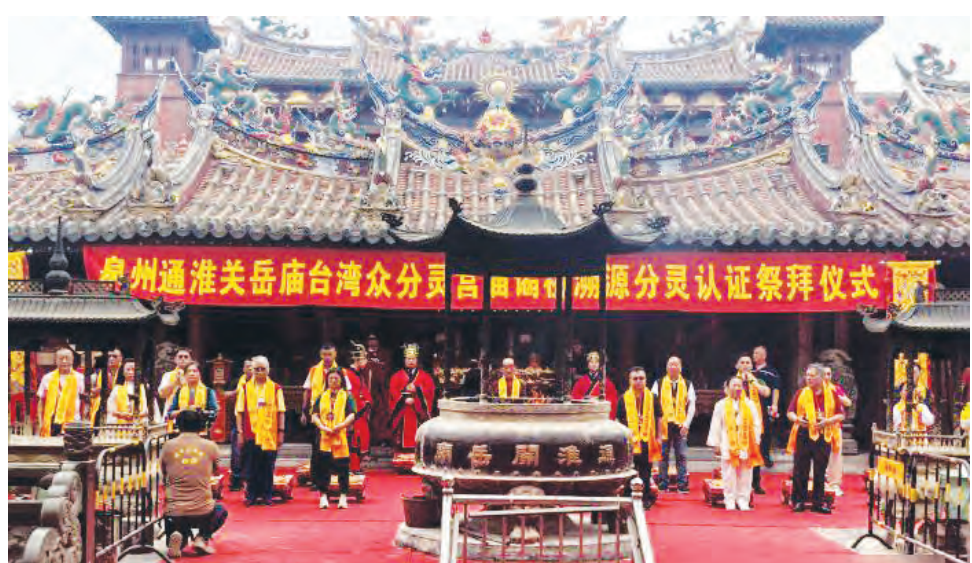
20家台湾宫庙代表齐聚福建泉州通淮关岳庙, 参加谒祖溯源分灵认证祭拜仪式。

传承弘扬关公文化、增进两岸宫庙交流, 20家台湾宫庙代表、逾百名台湾信众24日齐聚福建泉州通淮关岳庙, 参加谒祖溯源分灵认证祭拜仪式, 表达对关公精神的敬仰和崇拜。