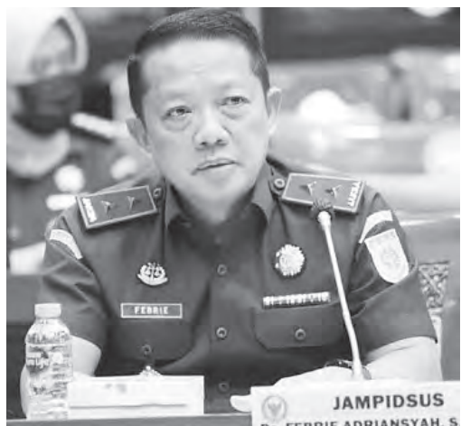
费布里表示，导致国家蒙受巨大损失。