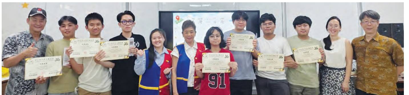
第一组荣获发表冠军者合影。