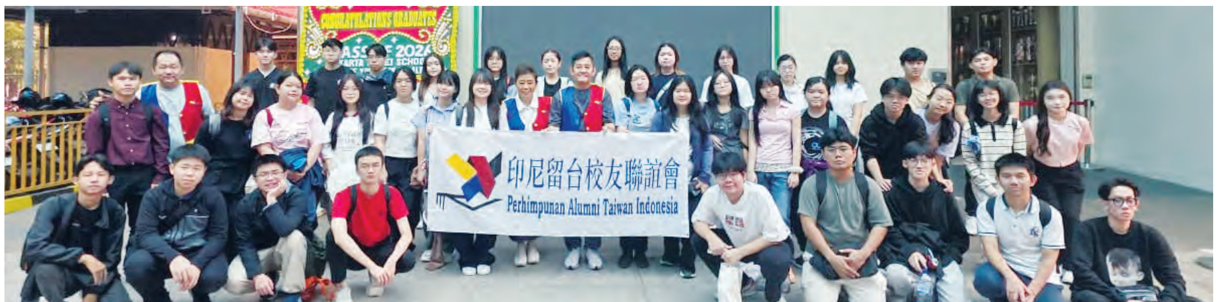
6月22日初相见于雅台校。