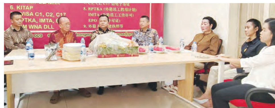
PT. YinZhong開業就獲貴賓前來加持。