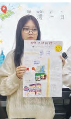
表现优异的学生做发表。