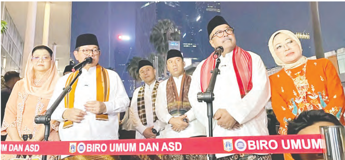
雅加达省长普拉莫诺(左二)及副省长拉诺(右二)在新闻发布会上发表讲话。

另一个优先发展计划是将印度尼西亚大酒店环形路附近的几家饭店连接地下通道，可方便前往地铁站。