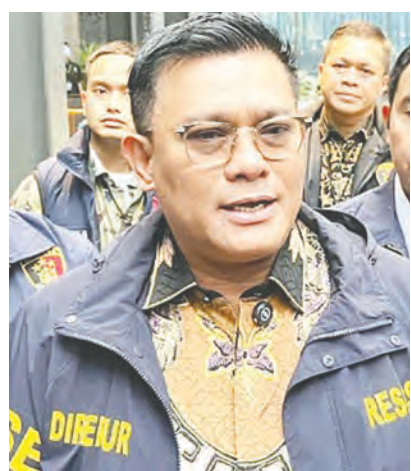
阿德表示，确保所有贸易和进口活动符合法律。

(雅加达讯) 自2025年12月以来，印尼国家警察反走私执法特遣队已从各类非法进口案件中，为国家挽回了近1兆盾的损失。