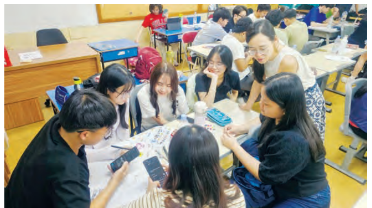
林芝廷老师认真指导发表作业。