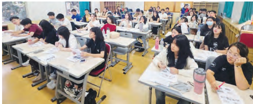
大家于课堂中努力学习。