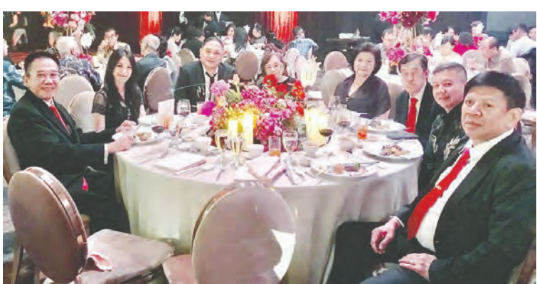
印尼许氏宗亲在晚宴上合影