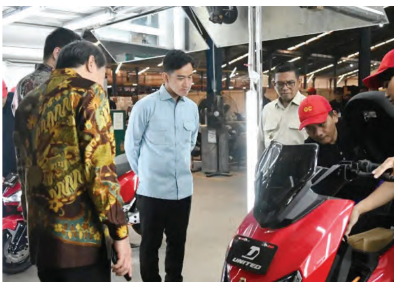
吉布兰考察工厂多条生产线。

但他强调称，免费营养餐纲领预算的优化不会影响食品质量或该纲领的主要目标。(ALW)