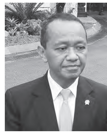
能源与矿务部长巴赫里尔。