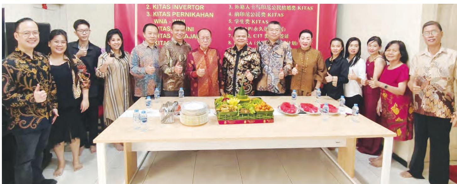
眾嘉賓與PT. YinZhong董事們合影。

印中国际服务中心 PT. Yin Zhong办公地点为: JL. Prismaraya Blok A9/40A Taman Kedoya Permai, Kebon Jeruk, Jakarta Barat 11530. 热线电话: +62 8111