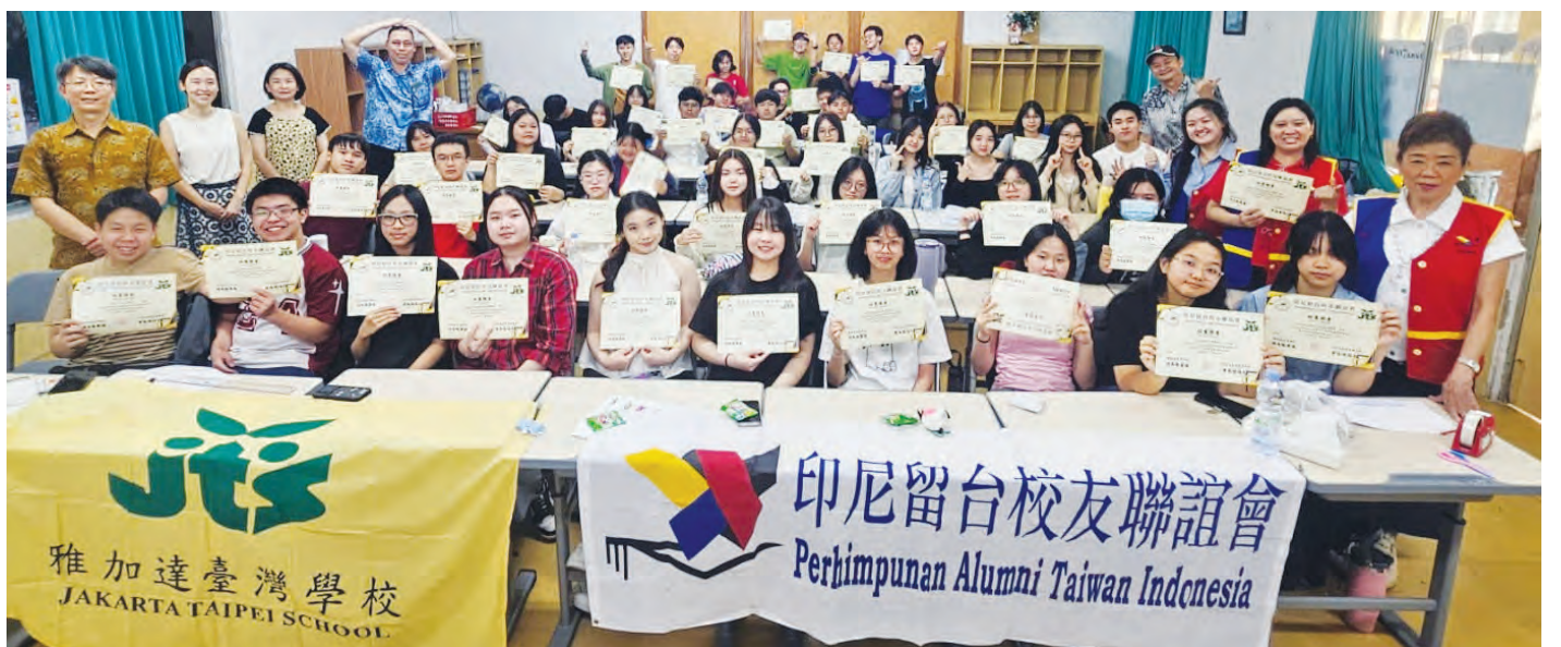
6月26日结训典礼时合影留念。