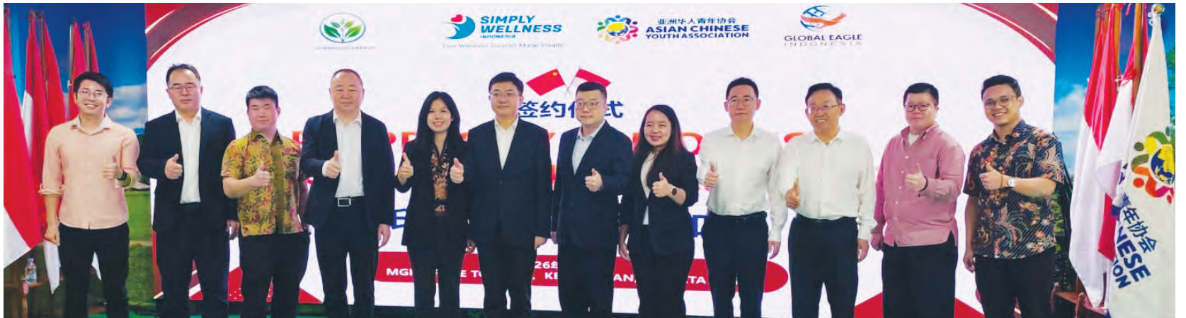
双方代表合影留念。