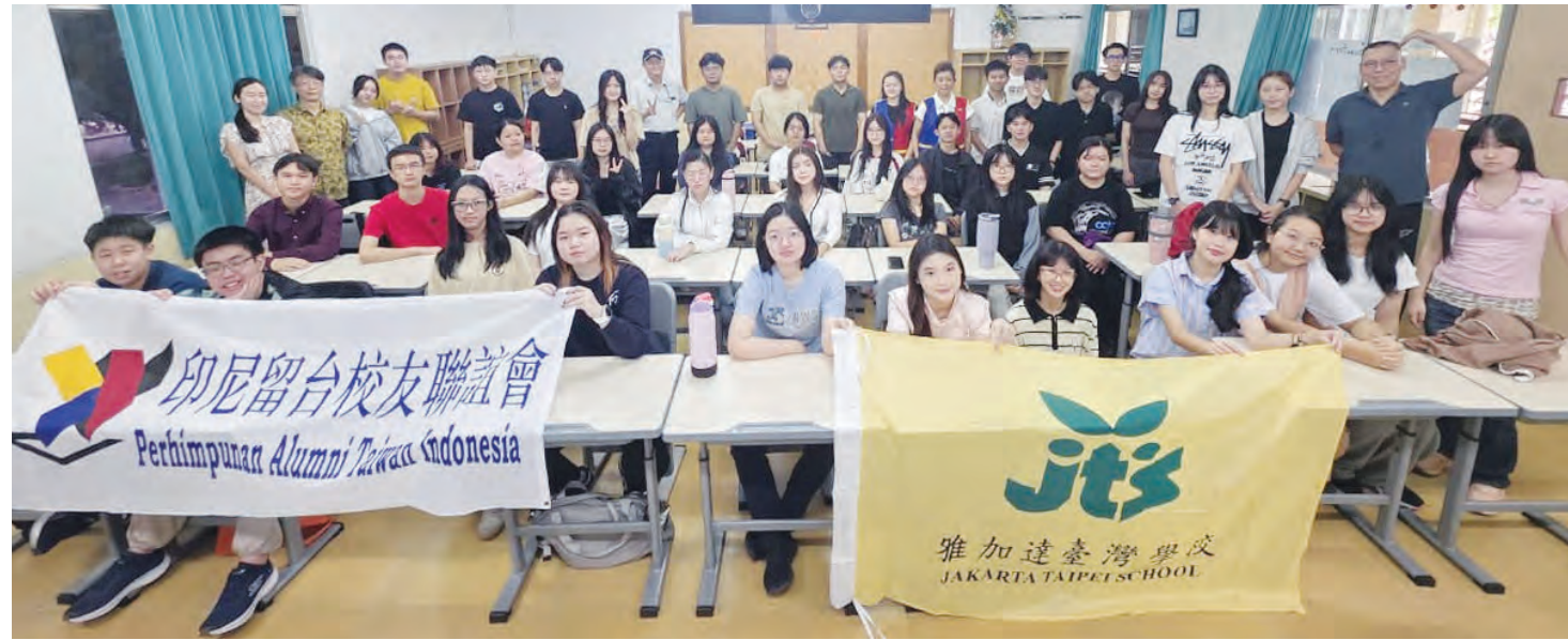
6月22日开训典礼时合影留念。

『在台湾XX某地一日游』, 内容需安排时间表: 包含购物(伴手礼)、搭乘交通工具、找特色美食、参访重要景点等, 大家无不绞尽脑汁查找资源、用心擘划分进合击, 计算也比较不同运具的车资与时间、住宿费等, 希望充分展现本周学习的成果, 通过此番模拟策划案, 相信已对每个人日後踏上台湾後, 建立起一定的认识与自信, 不会有人生地不熟的担忧, 那办理此次学习营的目的, 就算初步成功喔。每位同学也从周一初见面时的生涩羞赧, 进化到周五结训的互动热烈, 互道珍重再见, 想必已在彼此的年轻篇章中, 书写下色彩缤纷的一页, 未来就让他们勇往直前, 振翅高飞吧!