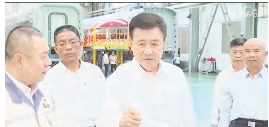
王小洪在吉林调研时强调 强化创新驱动 丰富政策供给 助力推动新时代东北全面振兴

他强调，要全面落实中共中央、国务院决策部署，把握大势、抢抓机遇，强化创新驱动，丰富政策供给，因地制宜发展新质生产力。