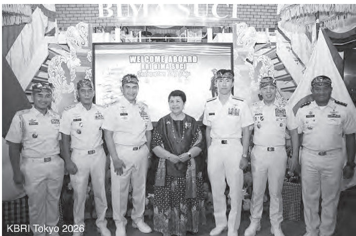
卡蒂妮大使(中)接待印尼海军。