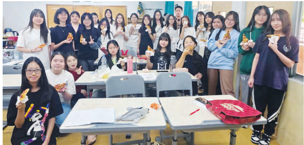
欢乐下午茶, 努力学习中。